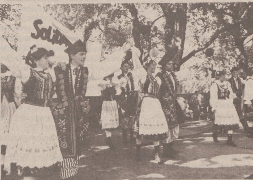
Zespół harcerski "Lechici" w dziarskim krakowiaku.