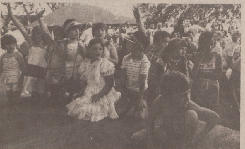
Szczególnie w tym roku, nie zabrakło dzieci. Organizatorzy zawsze przygotowują rozrywki dla wszystkich, zarówno najmłodszych jak też najstarszych.