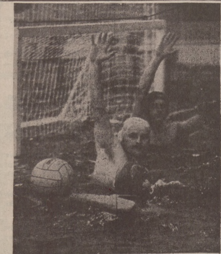
Ostatnio na pływalni warszawskiej Legii odbył się międzynarodowy turniej w pływaniu z udziałem 6 drużyn. Na zdjęciu fragment inauguracyjnego meczu pomiędzy zespołami Polski I (białe czepki) i Polski II.