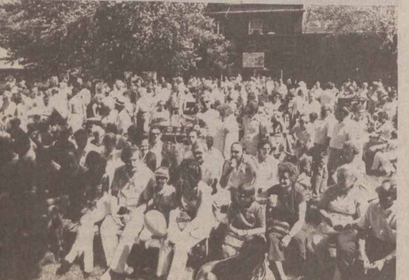
Licznie zebrana publiczność słucha przemówień.