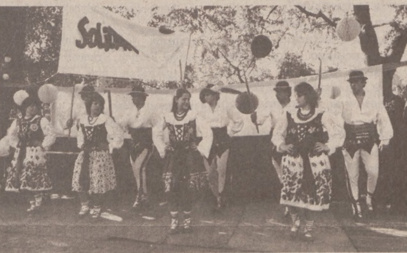
Zespół szkolny tańca przy Związku Podhalan w Ameryce w czasie występów.