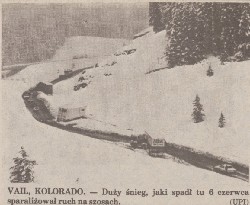
VAIL, KOLORADO. — Duży śnieg, jaki spadł tu 6 czerwca sparaliżował ruch na szosach.

W szwedzkim systemie wykorzystano właśnie doświadczenia sejsmograficznych pomiarów natężenia wstrząsów ziem. Dwadzieścia czujników, mających wielkość pudełka od papierosów i połączonych z komputerem, umieszcza się na zeskoku, kilka centymetrów pod śniegiem. Czujniki rejestrują wstrząsy spowodowane lądowaniem skoczka i przekazują je do komputera, który po kilku sekundach podaje "epicentrum" lądowania, czyli dokładną długość skoku. Urządzenie można zdemontować w ciągu kilku sekund. W marcu ub. roku wypróbowano je z powodzeniem, mierząc ponad 800 skoków na zawodach w Falun, Szwecja.