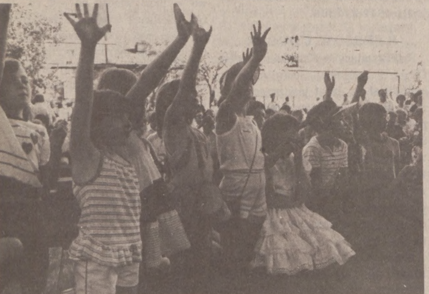
Dzieci żywo reagowały na pytania stawiane przez prowadzących program.