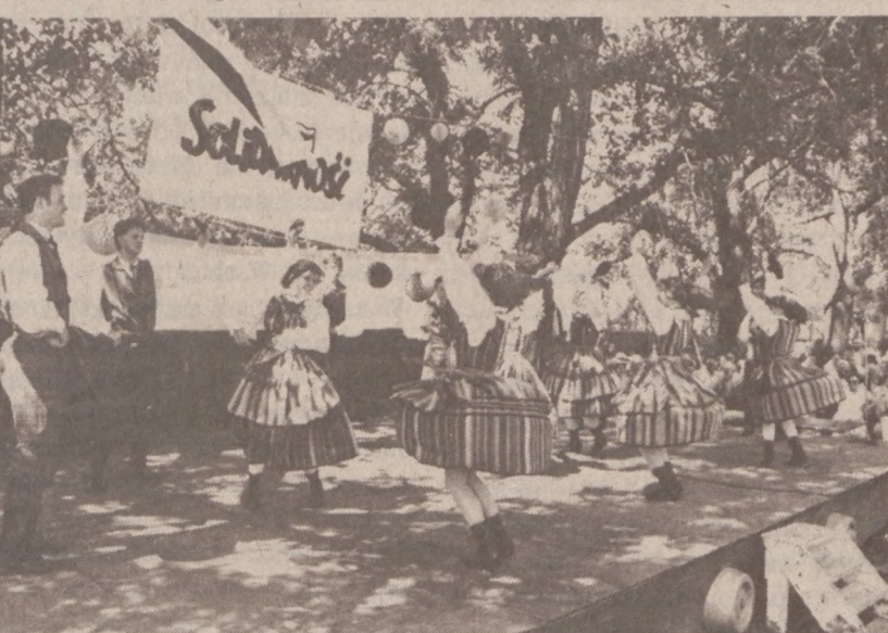
Zespół "Lechici" tańczy tańce opoczyńskie.