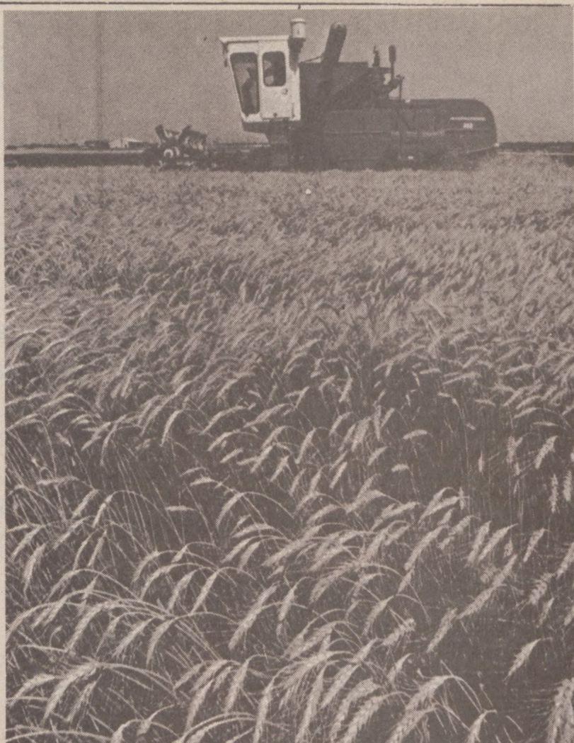
DALLAS, TEKSAS. — Susza jaka nawiedziła duże obszary Stanów Zjednoczonych wpłynęła niekorzystnie na zbiory zbóż. Na zdjęciu żniwa w okolicach Dallas.