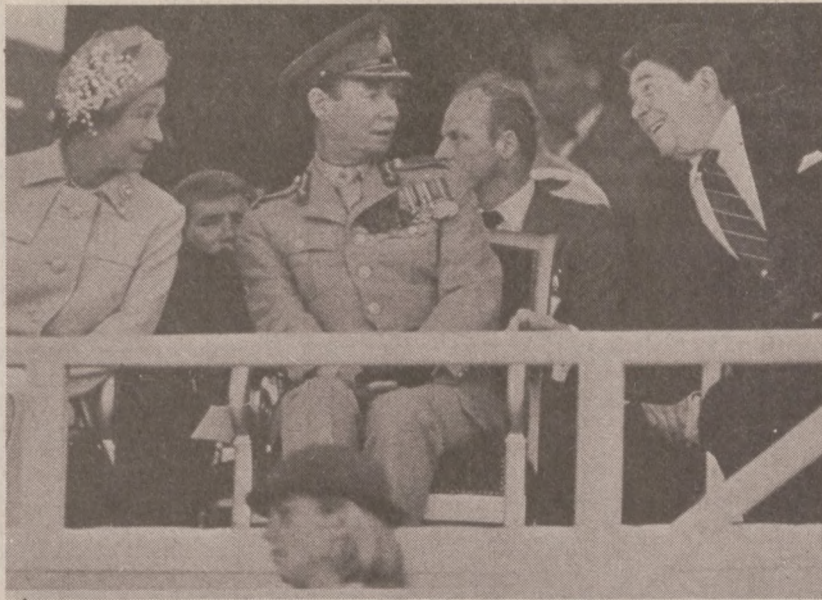
PLAŻA UTAH, NORMANDIA, FRANCJA. — W ceremoniach 40-lecia lądowania na plażach Normandii wzięli udział przedstawiciele państw alianckich. Na zdjęciu od lewej: królowa Wielkiej Brytanii Elżbieta II, wielki książę Luksemburga Jean i prezydent U.S. Ronald Reagan.

Zatwierdzono również przepis zabraniający uczelniom posiadającym rozległe tereny, na prowadzenie sklepów sprzedających drobne towary. Uczelnie będą mogły jedynie prowadzić sprzedaż pomocy naukowych i książek oraz napoi orzeźwiających, łakoci i zakąsek. W ten sposób wzięto pod ochronę właścicieli drobnych zakładów, prosperujących w sąsiedztwie miasteczek uczelniowych.