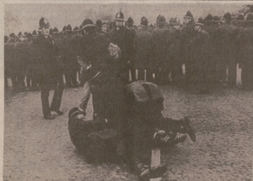
ORGREAVE, ANGLIA. — Policja w zmaganiach ze strajkującym górnikiem. Zdjęcie z 6 czerwca br.