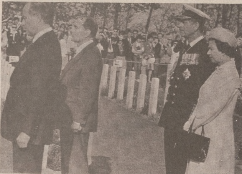
BENY SUR MER, FRANCJA. — Z uroczystości 40-lecia "D-Day". Na pierwszym planie premier Kanady Pierre Trudeau, obok prezydent Francji Francois Mitterrand oraz królowa Elżbieta II z księciem małżonkiem.

Cena złota utrzymała się w Londynie na poziomie $368.50 za uncję.