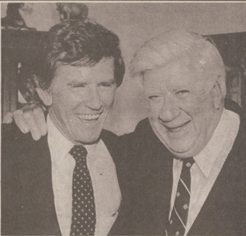
WASHINGTON. — Sen. Gary Hart, który ubiega się o nominację partii demokratycznej na stanowisko prezydenta U.S. spotkał się 7 czerwca z przewodniczącym Izby Reprezentantów Kongresu U.S. Thomasem O'Neill.