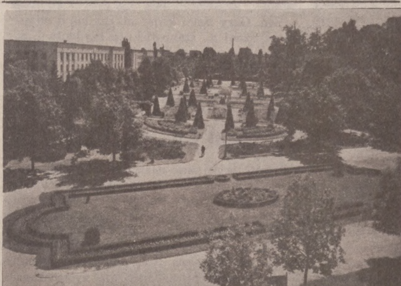
BIAŁYSTOK. — Park miejski.

W chwili wybuchu pożaru rodzice dzieci spali w sypialni na pierwszym piętrze. Dopiero krzyki zbudziły ich ze snu. Na ratunek było jednak za późno.