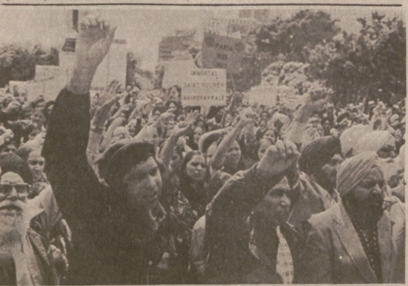
VANCOUVER. — Demonstrujący sikhowie 10 czerwca br.