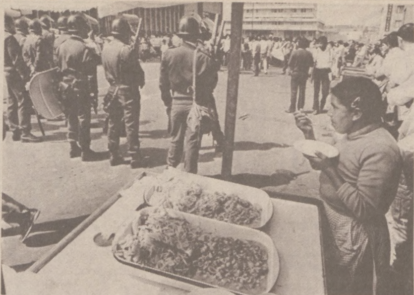
LIMA, PERU. — Policja peruwiańska gotowa do akcji w czasie demonstracji jakie się tu odbyły 9 czerwca br.