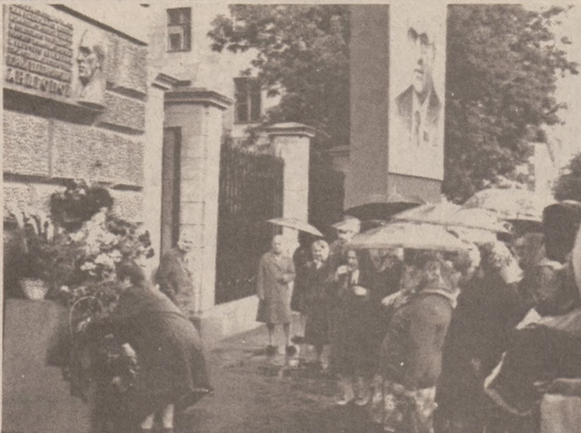
MOSKWA. — Mieszkańcy Moskwy składają kwiaty pod niedawno odsłoniętym pomnikiem Jurija Andropowa.

Mondale ma się spotkać z Tomem Bradleyem w celu przeprowadzenia rozmowy, rano w czwartek w Minneapolis. Kolejne spotkania byłego wiceprezydenta to: w czwartek po południu z sen. Lloydem Bentsenem, demokratą z Teksasu oraz w sobotę z mayorem San Francisco, Dianne Feinstein.