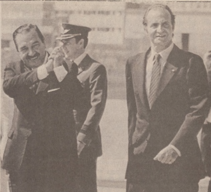
MADRYT. — Argentyński prezydent Raul Alfonsin odpowiada tłumom pozdrawiającym go. Przybył tu z wizytą 11 czerwca. Obok król Hiszpanii Juan Carlos.