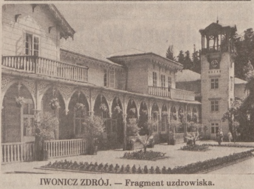
IWONICZ ZDRÓJ. — Fragment uzdrowiska.

Reakcja Washingtonu była ostrożna. Biały Dom odpowiedział, że jest gotów do wstępnych, nieformalnych rozmów, natomiast nie widzi jeszcze podstaw do negocjacji na dużą skalę. Opinię tę potwierdził prezydent Reagan podczas swojej ostatniej konferencji prasowej.