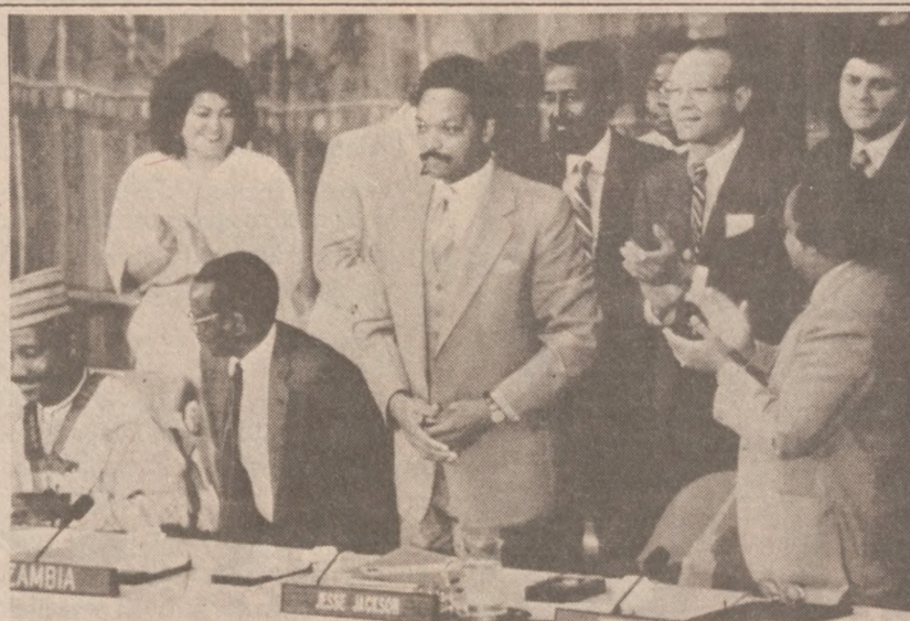
NARODY ZJEDNOCZONE. — Jesse Jackson, który ubiega się o nominację demokratów na stanowisko kandydata na prezydenta U.S. złożył wizytę w siedzibie Organizacji Narodów Zjednoczonych 18 czerwca br.