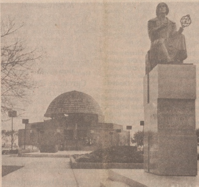
CHICAGO. — Pomnik Mikołaja Kopernika przed Planetarium Adlera.