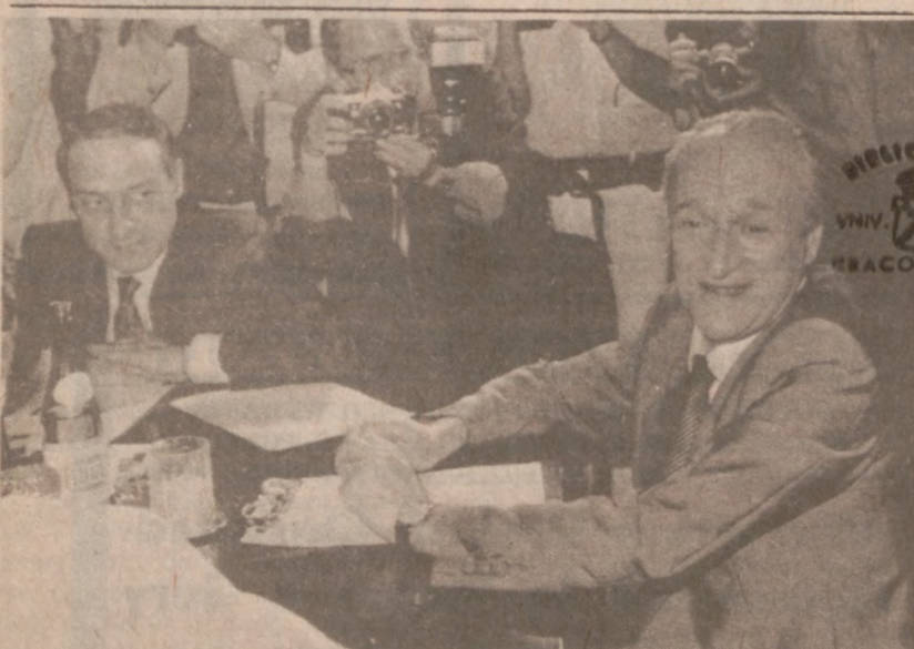
RZYM — Przywódca partii komunistycznej Włoch, Alessandro Natta w rozmowie z dziennikarzami 19 czerwca, br.

FBI prowadzić będzie dochodzenia w celu stwierdzenia w jaki sposób przymycono narkotyki do września znajdującego się niedaleko śródmieścia Chicago przy ul. Van Buren. Dochodzenia rozpoczęto w związku ze śmiercią jednego z więźniów, który zmarł na skutek zażywania zbyt dużej dawki narkotyków.