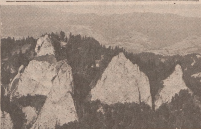
PIENINY. — Szeroka panorama gór.

Rzecznik wyjaśnił też, że porozumienie o ochronie środowiska dla nikogo nie powinno być mylące. Nie ma ono absolutnie nic wspólnego — ze sprawami militarnymi i ani o krok nie posunęło do przodu sprawy kontynuowania negocjacji odnośnie redukcji zbrojeń nuklearnych.