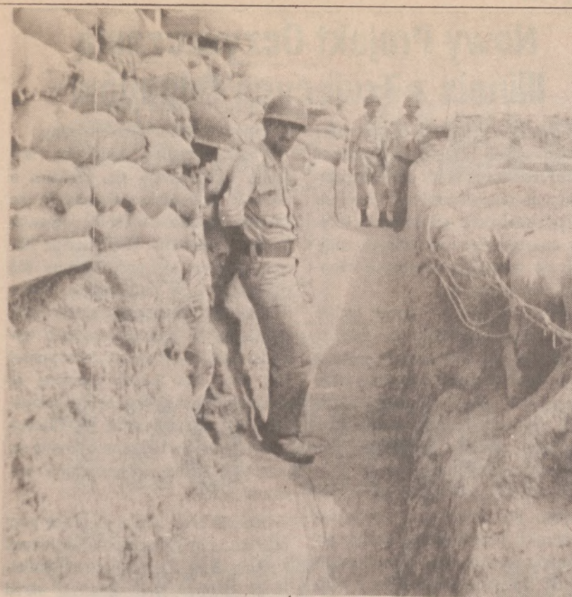
BASRA, IRAK. — Żołnierze iraccy odpoczywają w okopach na terenach, gdzie toczą się walki pomiędzy Iranem i Irakim.

Często mamy zapytania od naszych Czytelników: