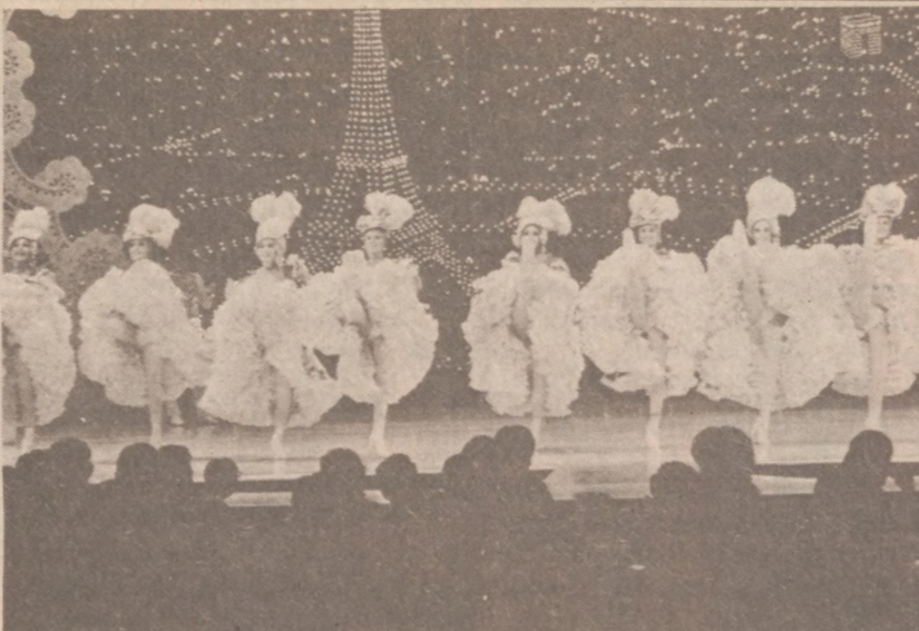
LAS VEGAS, NEVADA — Rewia pt. "Folies Bergere" znów wystawiana jest w jednym z lokali, po długim strajku pracowników hotelowych.

Pozew sądowy żąda odszkodowania tytułem zabezpieczenia wagonów, opłat za badania laboratoryjne, stwierdzające o toksyczności ładunku, kosztów przetrzymywania wagonów na torach kolejowych. Szkody zostały wycenione na sumę $178,000 licząc od marca po $1,080 dziennie. Oskarżenie stwierdza, że 18 wagonów jest niepotrzebnym obciążeniem dla Baltimore i Ohio, szczególnie gdy się zważy, że ładunek jest potencjalnie niebezpieczny dla pracowników kolei. Przedstawiciel kolei powiedział, że cały ładunek został odpowiednio przykryty, jest pilnie strzeżony, żeby zmniejszyć jego niebezpieczeństwo dla otoczenia.