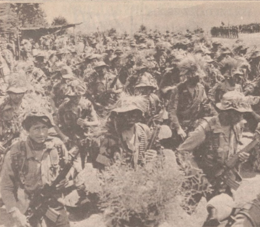
PEQUIN, SALWADOR. — Oddziały dwóch batalionów, wyspecjalizowane w zwalczaniu terrorystów, które zostały przydzielone do Trzeciej Brygady Armii Salvadora. Oddziały te zostały niedawno utworzone.