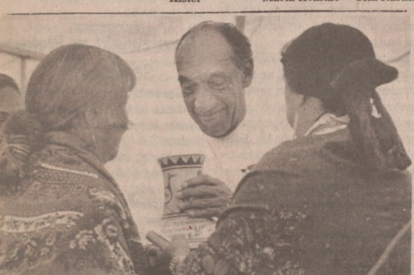
PUEBLO SANTO DOMINGO, N.M. — Prezydent Sri Lanki, Junius Jayewardene w czasie swej wizyty w USA, odwiedził mieszkańców Pueblo Santo Domingo, w Nowym Meksyku. Kobiety wręczyły mu prezent w postaci wazonów glinianych, które wyrabia się w tym osiedlu amerykańskich Indian.

młodzi chłopcy z tych krajów, wybrani przez miejscowe komitety UNESCO. Wsiadali w następny porcie, a na ich miejsce wchodziło dwóch kolejnych.