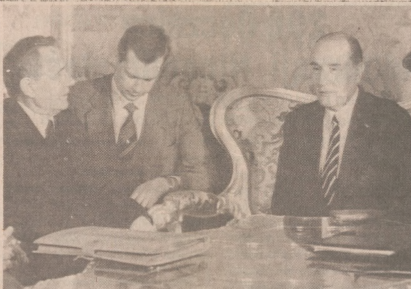
MOSKWA. — Echem wizyty prezydenta Francji Francois Mitterrand w Moskwie jest zdjęcie, przedstawiające francuskiego gościa (po prawej) w rozmowie z sowieckim ministrem spraw zagranicznych Gromyko.

Pogrzebem zajmuje się: Zakład Pogrzebowy B. F. Malec i Synowie. Telefon: 421-5800.