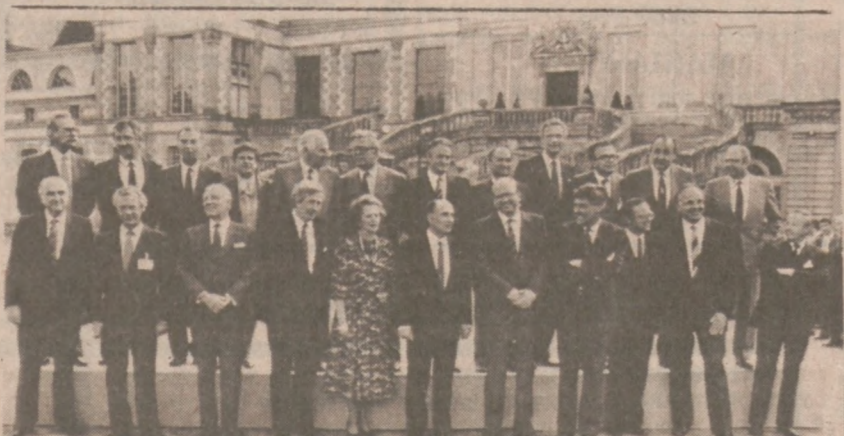
FONTAINEBLEAU, FRANCJA. — Wspólne zdjęcie uczestników zakończonej niedawno konferencji na szczycie przywódców krajów członkowskich Europejskiej Wspólnoty Gospodarczej. W czasie obrad ustalono budżet EWG, ratując tym samym organizację przed bankructwem.