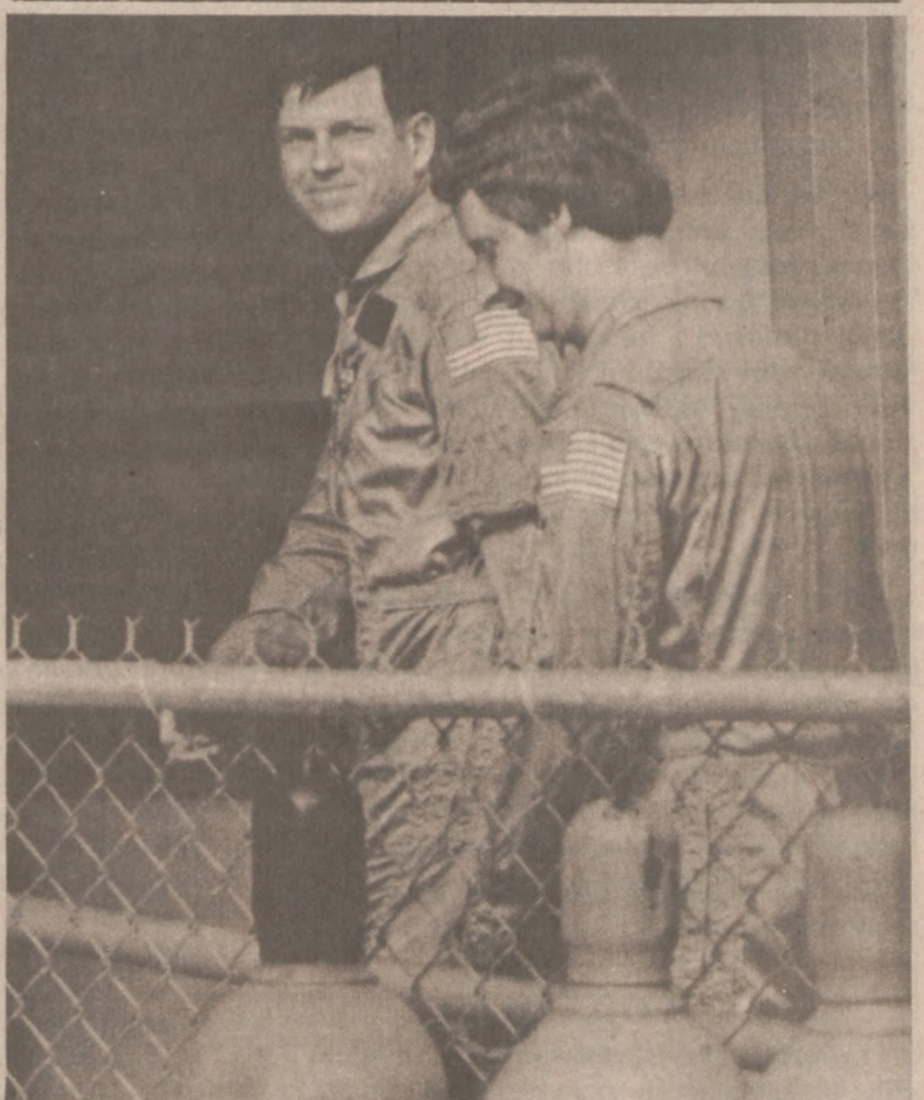
PRZYŁADEK CANAVERAL — Załoga wahadłowca "Discovery" w drodze do bazy, po nieudanej próbie wystrzału pojazdu 26 czerwca br.

(Przejęty tu artykuł Milovana Djilasa ukazał się na łamach The Wall Street Journal, 30 maja 1984).