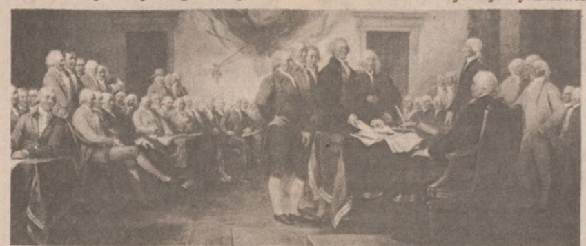
Zdjęcie obrazu olejnego ilustrującego podpisanie "Deklaracji Niepodległości" przez reprezentantów 13 Kolonii 4 lipca 1776 r.

1. Doktryna wszyscy równi wobec prawa. 2. Doktryna nienaruszalnych praw — "ludzie obdarzeni są przez Stwórcę pewnymi nienaruszalnymi prawami, do których należy prawo do życia, wolności i starania się o szczęście osobiste". 3. Teoria, że początku rządu należy szukać w świadomej akcji czy umowie