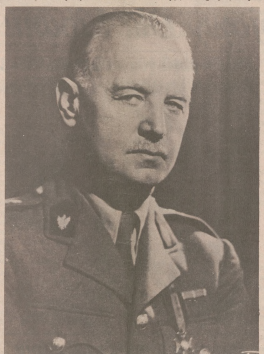
Gen. Broni Władysław E. Sikorski

3) Europejskość Sikorskiego, która jego gorącemu patriotyzmowi nadawała podłoże światowe i która obdarzała go rzadką właściwością nadawania sprawom polskim rysów i charakteru spraw światowych. Gdy najwybitniejsi mężowie świata stwierdzając, że zginął nie tylko