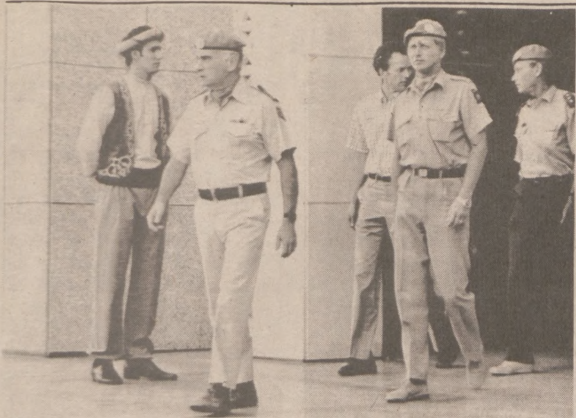
BAGDAD. — 25 czerwca specjaliści wojskowi z ramienia ONZ dokonali inspekcji obecnej sytuacji na froncie irańsko-irackim. Przedstawieni na zdjęciu oficerowie reprezentują siły zbrojne Finlandii, Szwecji i Irlandii.