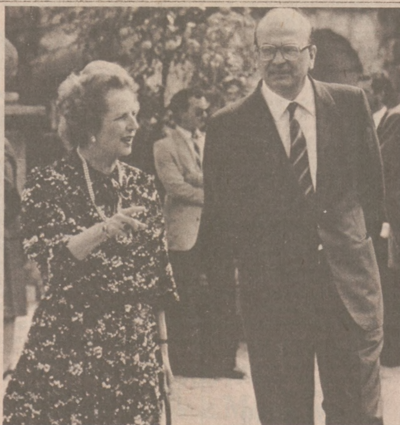
FONTAINEBLEAU, FRANCJA. — Premier Wielkiej Brytanii, pani Margaret Thatcher oraz premier Włoch, Bettino Craxi po zakończeniu jednej z sesji toczącej się niedawno konferencji na szczycie przywódców krajów członkowskich EWG.