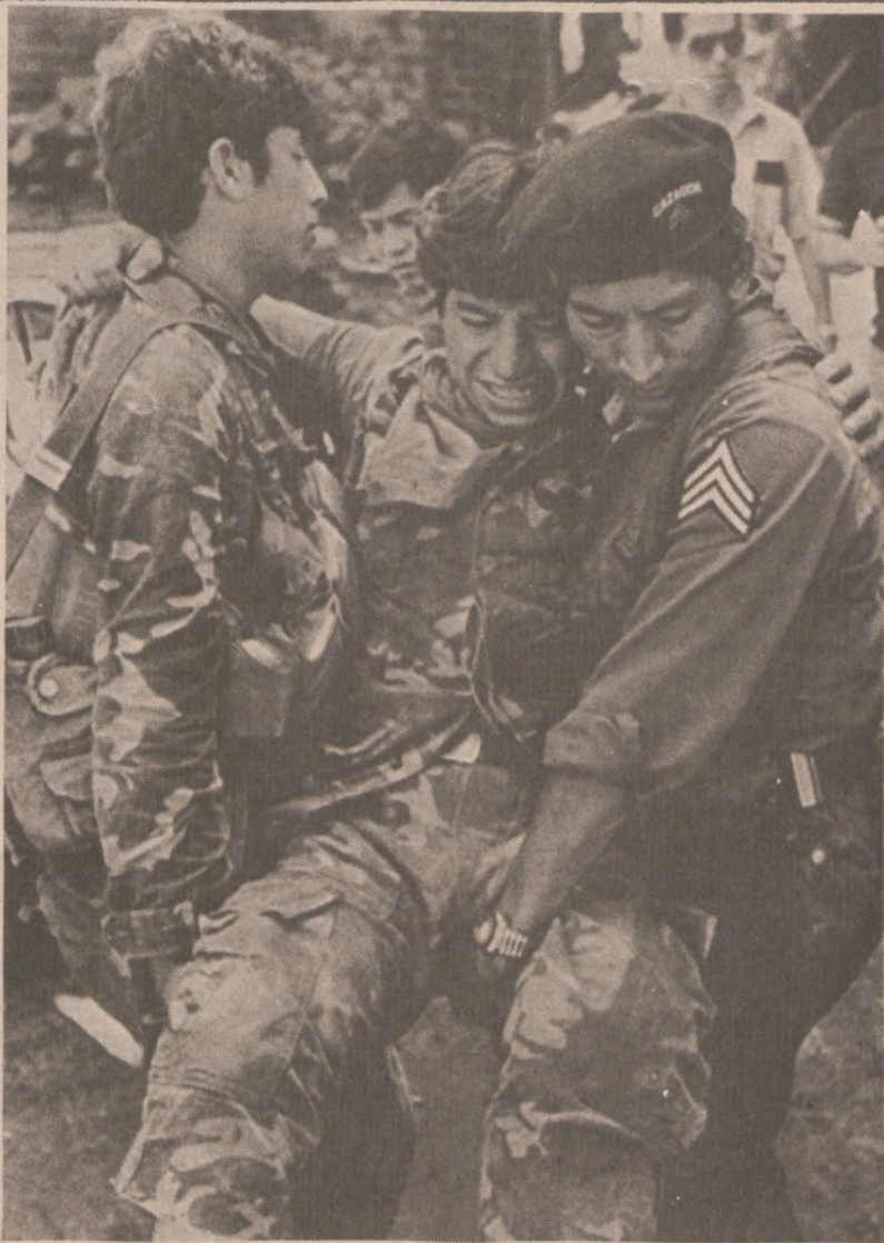
ILOBASCO, SALWADOR — Koledzy niosą rannego żołnierza salvadorskiego, po starciach z lewicowymi rebeliantami w pobliżu ważnej hydroelektrowni w Ilobasco. W walkach, jakie toczyły się tam 28 czerwca ponad 20 żołnierzy poległo, a ponad 30 innych zostało rannych.