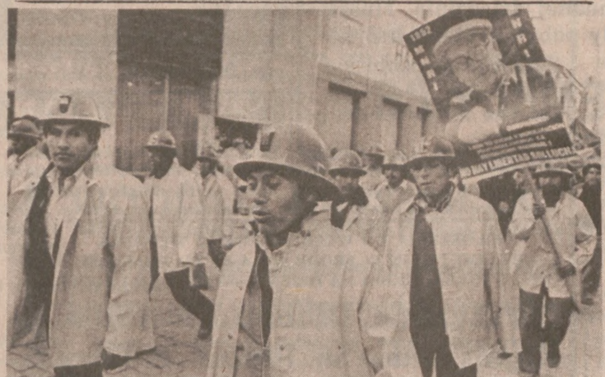
LA PAZ, BOLIWIA — Uczestnicy demonstracji, którzy przemarszerowali ulicami La Paz 2 lipca, manifestowali poparcie dla prezydenta Hernana Silesa Zuazo.

Jak dotąd nie wiadomo co było powodem awarii silnika. Samolot zaczęli wsiadać do niego przekożółkował się i runął na trawę pola golfowego podwozkiem do góry.