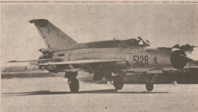
LONDYN — Stany Zjednoczone zamierzają zakupić w Chinach 24 samoloty sowieckiej produkcji typu MiG-21. Na zakupionych samolotach amerykańscy piloci będą uczeni najlepszych metod walki powietrznej z MiGami. (UPI)

Wskutek burz 11 osób zginęło w stanie Alabama; wichura dochodząca do szybkości 70 mil na godzinę wyrzuciła na rzecze Tennessee łódź o długości 90 stóp. Cztery osoby zginęły w wypadkach drogowych w Pensylwanii; trzy — na śliskiej od deszczu szosie w stanie Connecticut, w wypadku drogowym.