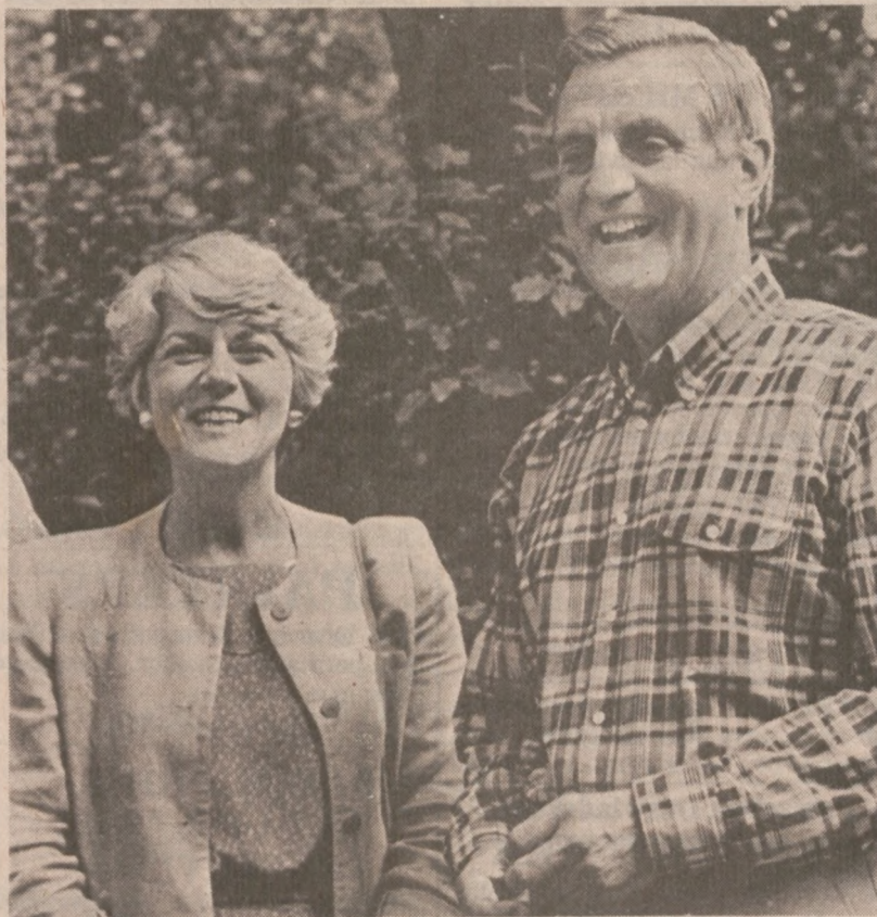
NORTH OAKS, MINN. — Walter Mondale, jeden z demokratycznych kandydatów do nominacji prezydenckiej oraz członkini Izby Reprezentantów, pani Geraldine Ferraro (D-Nowy York). Pani Ferraro jest rozpatrywana jako ewentualna kandydatka do wiceprezydentury.