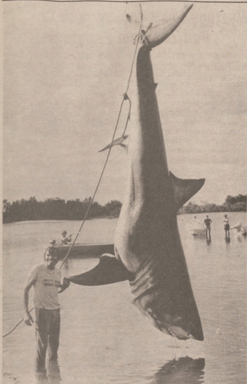
SYDNEY, AUSTRALIA. — Po 4,5 godzinnej walce, rybak z Queensland pokonał olbrzymiego rekina, którego długość wynosiła 5 m i 20 cm (17,6 stopy). Rekin ważył przeszło 2 tony.