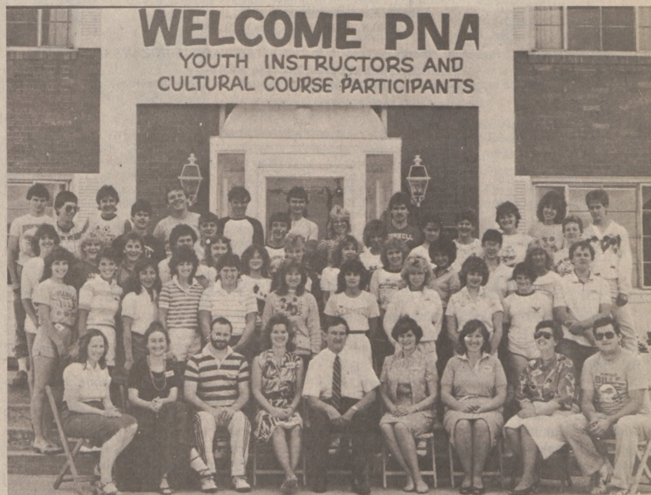
Już w najbliższy weekend zakończy się kolejny kurs instruktorski, jaki odbywa się w Kolegium Związkowym "Alliance College" w Cambridge Springs, Pa. Na zdjęciu uczestnicy kursu instruktorskiego wraz ze swymi wykładowcami.