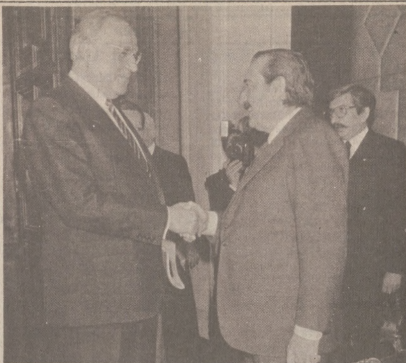
BUENOS AIRES, ARGENTYNA — Kanclerz Niemiec Zachodnich Helmut Kohl (po lewej) wita się z prezydentem Argentyny Raulem Alfonsinem. Przywitanie przygląda się minister spraw zagranicznych Argentyny Dante Caputo. Zdjęcie z 5 lipca br.