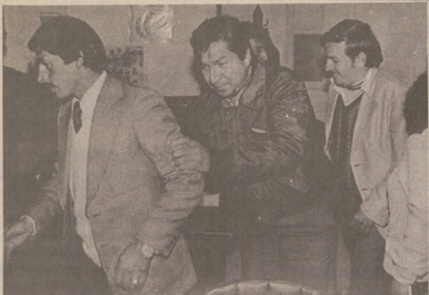
LA PAZ, BOLIWIA — Dwóch porywaczy prezydenta Boliwii Hernana Siles Zuazo opuszcza salę sądową po złożeniu zeznań.