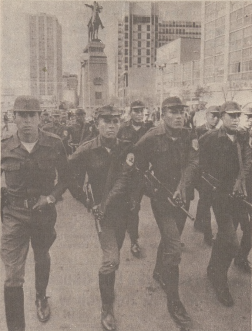
LA PAZ, BOLIWIA — Żołnierze boliwijscy maszerują w czasie obchodów rocznicy niepodległości Wenezueli 5 lipca br. W Boliwii w tym czasie trwał strajk powszechny. Strajkujący domagali się wyższych zarobków i obniżki cen.

Projekt komisji został zatwierdzony w śróde stosunkiem głosów 3 do 2. W dniu 24 lipca przesłany będzie do Prezydenta. Prez. Reagan będzie mieć 60 dni czasu na odrzucenie go lub zaakceptowanie.