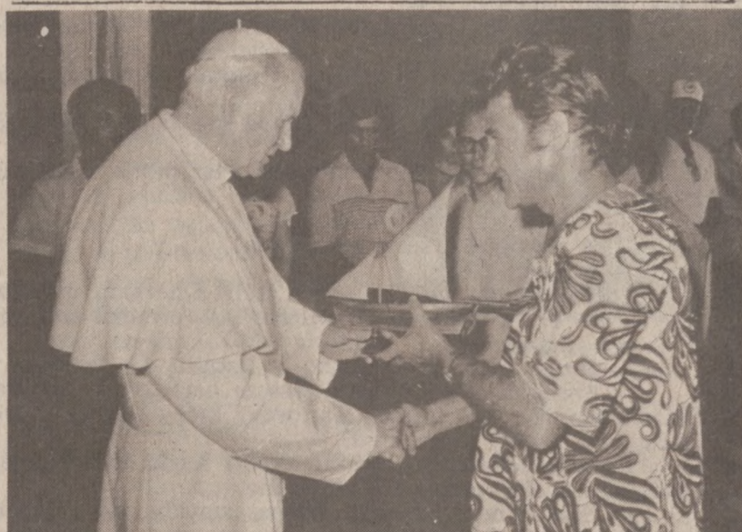
WATYKAN. — Ojciec Święty przyjął na audycji rybaków z Filipin, Indii i Ameryki Łacińskiej. Rybacy wręczyli Papieżowi model kutra rybackiego. Audycja odbyła się 9 lipca br.