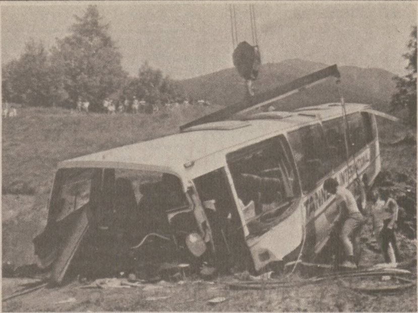
ZERMATT, SZWAJCARIA — Autobus wiozący amerykańskich studentów na wycieczkę w Alpy, uległ katastrofie, na krętych drogach alpejskich. Na szczęście pasażerowie odnieśli jedynie lekkie obrażenia, nie było wypadków śmiertelnych. Katastrofa wydarzyła się 9 lipca br. (UPI)

Z raportów świadków wynika, że po zakończeniu meczu wśród widzów rozgorzała bójka rzekomo na tle rozlanego piwa. Tłum wychodzących ze stadionu napierając do wyjścia, swym ciężarem spowodował upadek dwóch ofiar.