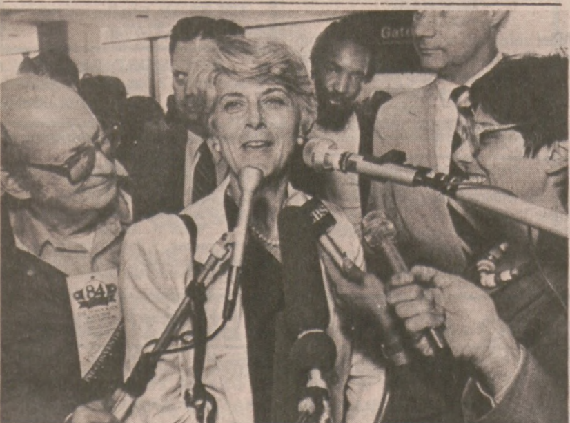
SAN FRANCISCO.—Kong. Geraldine Ferraro otoczona dziennikarzami tuż przed odlotem 10 lipca na spotkanie z Walterem Mondale. Jak wiadomo, Mondale ogłosił oficjalnie, że kong. Ferraro będzie kandydatką na urząd wiceprezydenta w nadchodzących wyborach prezydenckich. Mondale zabiega o nominację swej partii (demokratycznej) na kandydata na prezydenta.

Jest to już drugi podobny incydent. Firmy posiadające tego rodzaju samochody, mają zamiar dodatkowo je zabezpieczyć przed przyszłymi napadami.