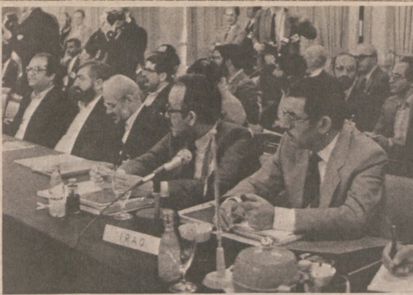
WIEDŃ, AUSTRIA.—Zdjęcie z obrad ministrów państw OPEC, które odbyły się 10 lipca br.

Uczestnik P.S. — Wstąpił na członka i złożył pomoc na Fundację AK, która kontynuuje ideologię Polskiego Państwa Podziemnego z lat wojny i która roztacza opiekę nad dokumentami z tych czasów, pisząc na adres: 6754 N. Ionia Ave., Chicago, IL 60646.