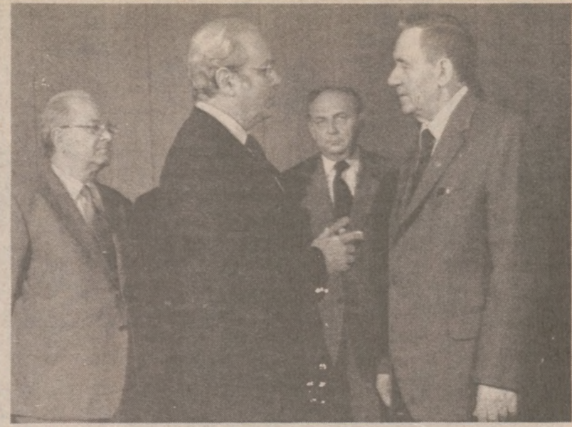
MOSKWA. — 11 lipca przybył do Moskwy z oficjalną wizytą Sekretarz Generalny ONZ Javier Perez de Cuellar. Na lotnisku moskiewskim przywitani go przedstawiciele ZSRR z Andrejem Gromyko na czele.

W czasie, kiedy kanclerz Kohl odbywał konferencję z prezydentem Duarte, na zewnątrz budynku około 30 osób urządziło demonstrację.