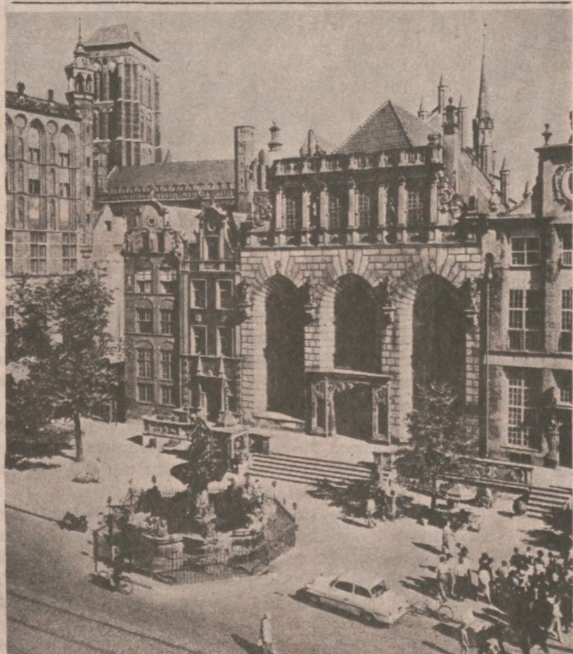
GDĄSK. — Dwór Artusa na Długim Targu.

Wykopanie długiego na sześć stóp i szerokiego na trzy stopy tunelu, w odległości zaledwie 600 stóp od wieży uzbrojonych strażników, zajęło im większość nocy.