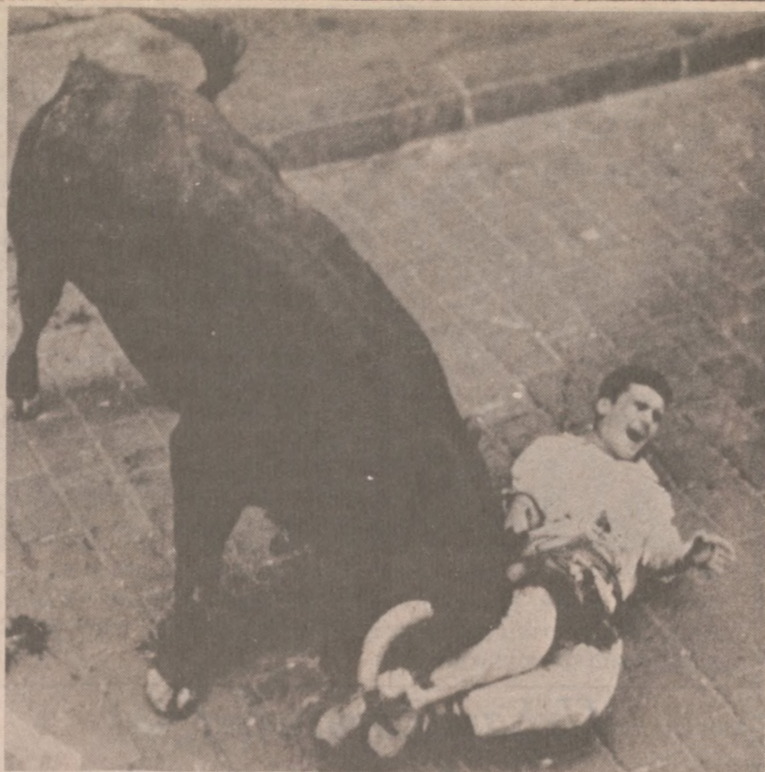
PAMPLONA, HISPANIA.—Żołnierz amerykański został zaatakowany przez byka i poważnie zraniony. Wypadek zdarzył się 10 lipca br (UPI)

Finały muszą być rozgrywane w innych miastach, nie związanych z klubem występującym w finale. W jakim mieście? Decyzja zapadnie po przeprowadzeniu losowania rozgrywek ćwierćfinałowych.