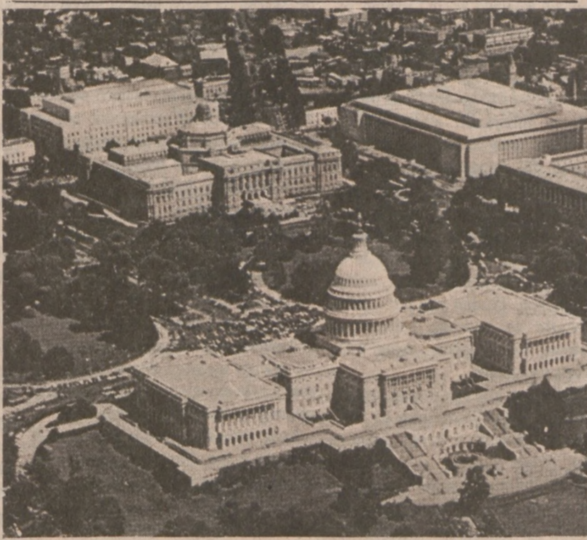
WASHINGTON. — Kapitol — siedziba Kongresu Stanów Zjednoczonych.

Prasa Republiki Federalnej komentuje nowe porozumienie jako kolejny krok w kierunku poprawy stosunków pomiędzy obywatelami państwami niemieckimi, które do niedawna układały się jak najgorzej. W ich poprawie niewątpliwie jeszcze bardziej pomoże wizyta Honeckera w RFN, planowana pomiędzy 26 a 29 września tego roku.