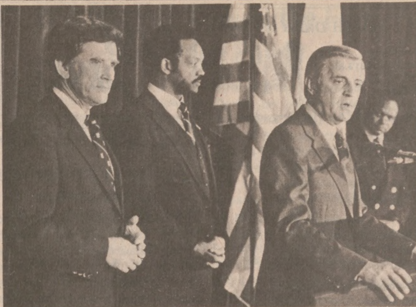
SAN FRANCISCO. — Po spotkaniu trzech pretendentów do nominacji partii demokratycznej na kandydata do fotela prezydenckiego, jakie odbyło się w czasie korwencji demokratycznej 16 lipca, odbyła się konferencja prasowa, w czasie której omówiono całe spotkanie. Od lewej stoją: sen. Gary Hart z Kolorado, Jesse Jackson i Walter Mondale.

I jeszcze jedno: działacz samorządu musi pamiętać, że to nie czas "Solidarności", kiedy można było iść przebojem do przodu. Najskuteczniejsza jest "mięka taktyka". Samorząd podejmuje uchwały. Jeżeli dyrektor ją zaakceptuje, to znaczy, że można iść jeszcze pół kroku dalej. Jeżeli dyrektor ją wstrzymuje, trzeba roze-