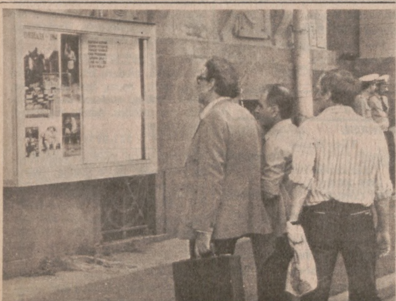
MOSKWA. — Obywatele sowieccy przed ambasadą U.S.A w Moskwie.

Jak dotąd, władze kościelne nie zakończyły dochodzeń odnośnie placu posagu.