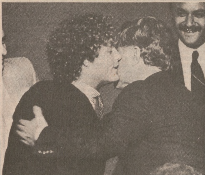
SAN FRANCISCO. — Po wygłoszeniu przemówienia w czasie konwencji demokratów na temat inwalidów, Edward Kennedy Jr. w uścisku ojca senatora Edwarda Kennedy, 18 lipca br.