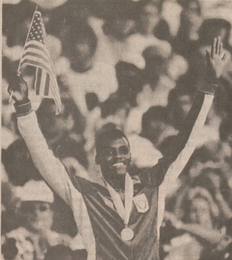
LOS ANGELES.—Carl Lewis—Amerykanin, który zdobył złoty medal w biegu na 200 m.

Z Medicare korzysta 12% mieszkańców Chicago, a z Medicaid 21% mieszkańców miasta. Obie instytucje pomocy rządowej nie płacą szpitalom ekwiwalentu faktycznego kosztu leczenia szpitalnego i dlatego szpitale podnoszą swoje opłaty ludziom mają-