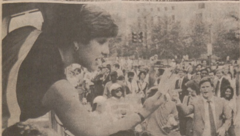
WASHINGTON. — Po zakończonej Olimpiadzie, sportowcy amerykańscy, zdobywcy medali rozpoczęli podróż po całym kraju, odwiedzając różne miasta. Na zdjęciu, serdecznie witani w stolicy kraju, 14 sierpnia br.