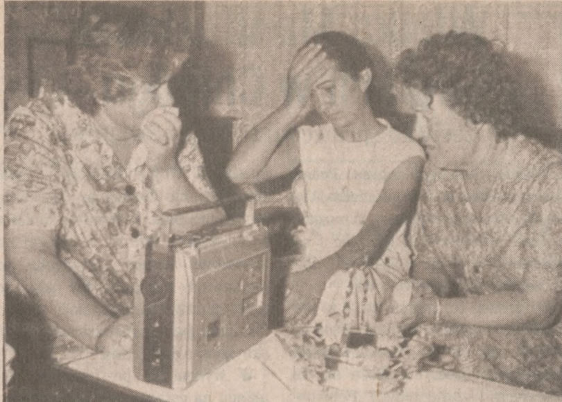
LAS PALMAS DE GRAN CANARIAS, HISZPANIA. — Rodziny załogi trawlera łowiącego sardynki po otrzymaniu wiadomości o tym, że trawler ten zaginął bez wieści, 13 sierpnia br.

Według komunikatu Ministerstwa Obrony Nikaragui, na innych odcinkach walki zostało zabitych 52 rebeliantów. Zginęło pięciu żołnierzy armii Sandinistów, sześciu zostało rannych. Rząd Nikaragui twierdzi, że w wyniku starć z wojskami, zginęło od początku sierpnia 242 rebeliantów, 160 zostało rannych. Danych tych nie można zweryfikować.