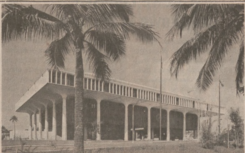
HAWAJE. — Budynek Kapitolu stanowego. 21 sierpnia br. minęła 25 rocznica przyłączenie się Hawajów jako 50 stanu do Stanów Zjednoczonych.

Choć przeznaczenie jednostek marynarki wojennej ZSRR nie budzi najmniejszych wątpliwości, ich obecność w pobliżu amerykańskiego wybrzeża jest zgodna z prawem międzynarodowym. Zaden z sowieckich okrętów nie naruszył wód terytorialnych Stanów Zjednoczonych.