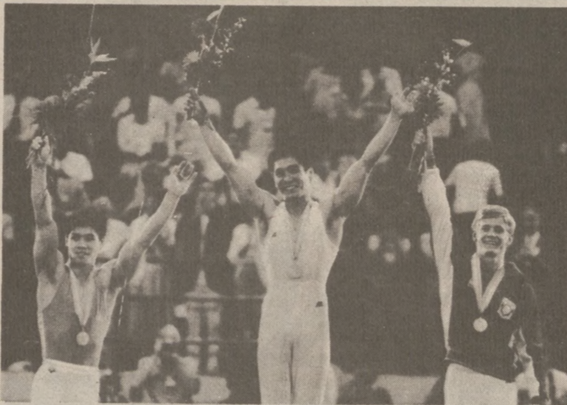
LOS ANGELES.—Japończyk Koji Gushiken (w środku) zdobywca złotego medalu w gimnastyce. Po prawej, Amerykanin Peter Vidmar, zdobywca srebrnego medalu oraz Chińczyk Li Ning, który zdobył brązowy medal.

Rzecznik rządu stwierdził, że w przyszłości nie będzie już żadnych manewrów na terenach państwowych Grecji z udziałem amerykańskich jednostek wojskowych.