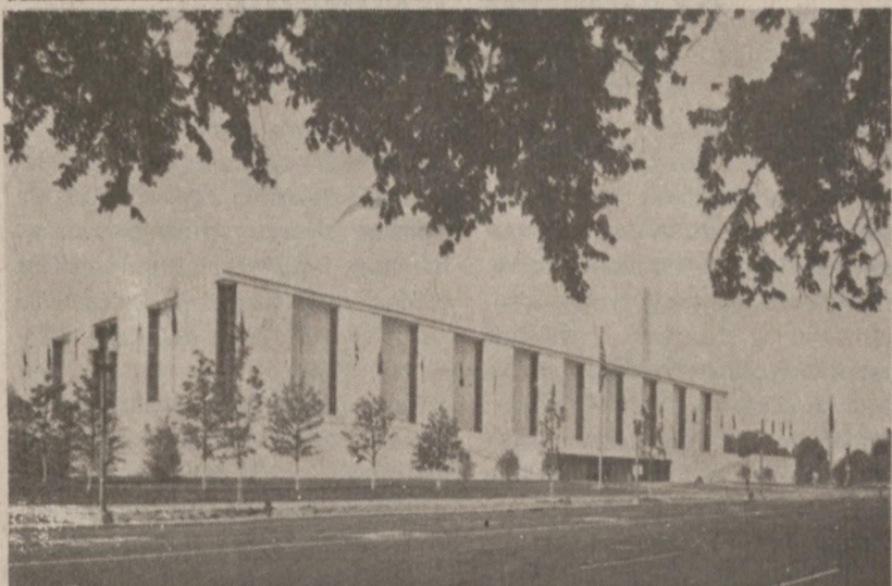
WASHINGTON, D.C. — Instytut Smithsona — Muzeum Historii i Technologii.

Regan utrzymuje, że administracja prez. Reagana zdoła opanować niedobór w budżecie federalnym, wynoszący obecnie $170 bil. Sądzi on, że uda się osiągnąć bez wprowadzenia w życie podwyżki podatków — przy jednoczesnym ograniczeniu wydatków.