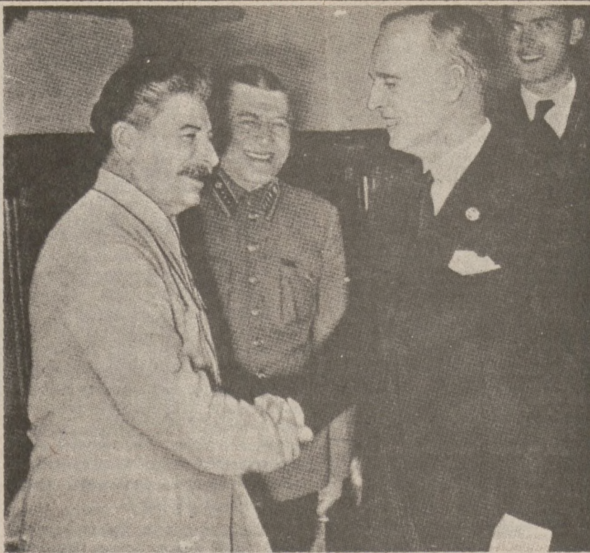
Stalin z Ribbentropem po podpisaniu niemiecko-sowieckiego układu o nieagresji, 23 sierpnia 1939 r.

Posadzonymi sędziowie utrzymują jednak, że nie są winni żadnych wykroczeń przeciw kodeksowi, ponieważ w par. 65 wyraźnie wspomniano o tym, że sędziowie mogą otrzymywać "umiarkowane" wynagrodzenia za usługi takie, jak np. wygłoszenie odczytu czy też wykładu oraz... "inne." Zdaniem posadzonych słowo "inne" oznacza ceremonie ślubne.