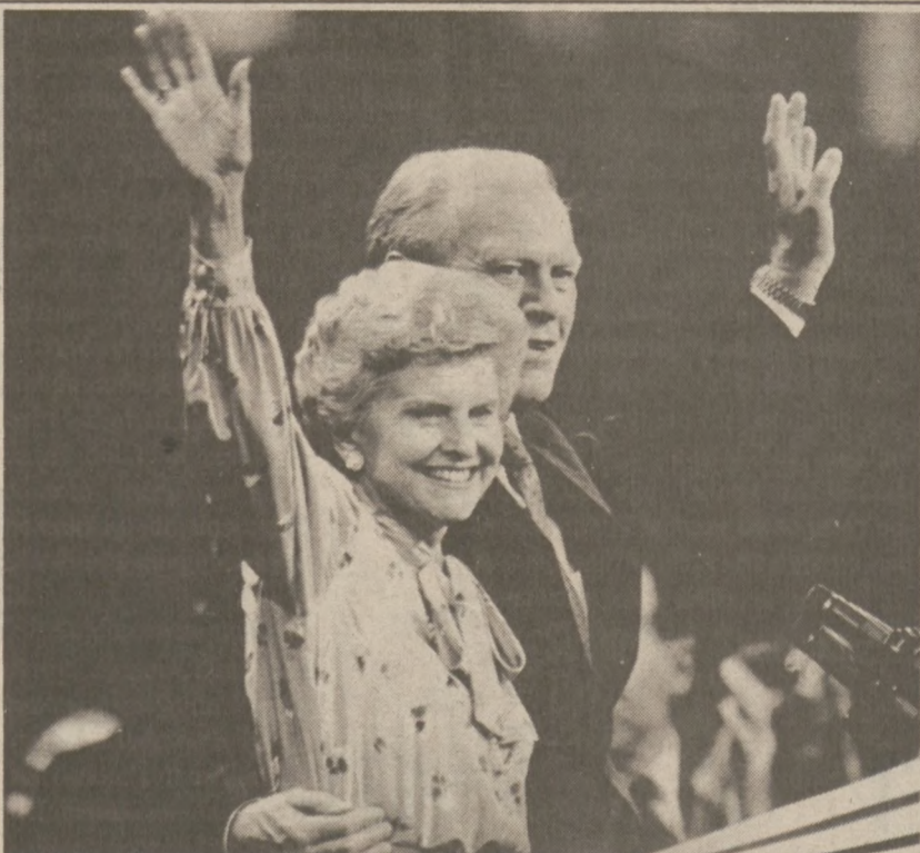
DALLAS — Były prezydent U.S. Gerald Ford z żoną Betty w czasie konwencji republikanów, po wygłoszeniu przemówienia.