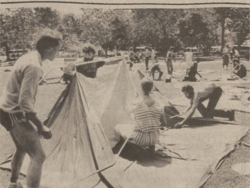
WASHINGTON — Grupa reprezentująca bezdomnych, rozkłada namioty w parku obok Białego Domu, chcąc zaprotestować przeciw, ich zdaniem, nieprawdziwemu raportowi o liczbie bezdomnych Amerykanów. Demonstracja odbyła się 15-go sierpnia.

Skorupki od jajek są znakomitym środkiem czyszczącym. Drobnopokruszonymi można wyszorować zlew, umywalkę czy wannę, a także np. kryształową karafkę lub wazon.