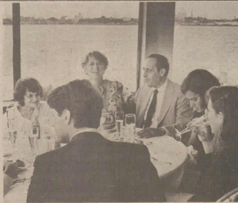
NOWY YORK — Geraldine Ferraro z rodziną, obchodzą swe 49-te urodziny, 26 sierpnia br.