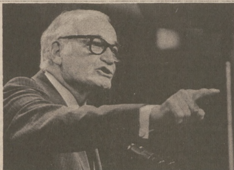
DALLAS — Pomiennie przemówienie do zebranych na konferencji republikańskiej wygłosił 22 sierpnia senator Barry Goldwater.

Kard. Shehan założył po przejściu na emeryturę fundusz pomocy dla dzieci, na naukę w szkołach katolickich.