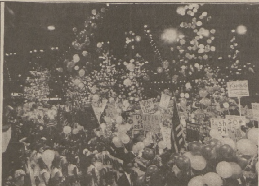
DALLAS - Widok sali konwencyjnej w chwili, gdy entuzjastycznie aprobowano nominację prez. Reagana i wiceprezydenta Busha, 22 sierpnia br.

Niedziela, 9 września - Major Division Wisła - Mayas, Triton College godz. 4:15 po poł.