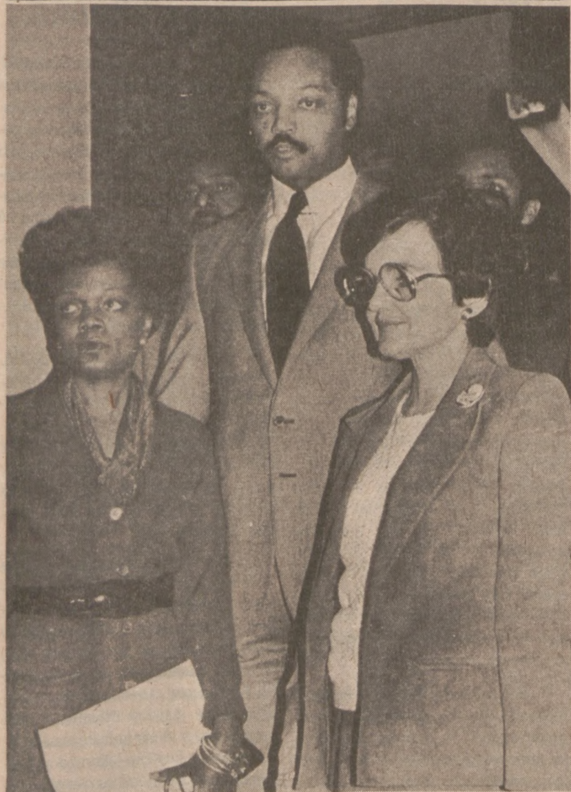
NOWY YORK — Pastor Jesse Jackson w towarzystwie żony i matki dwóch Amerykanów, uprowadzonych przez terrorystów na Bliskim Wschodzie. Jackson ma zamiar starać się o zwolnienie amerykańskich więźniów.