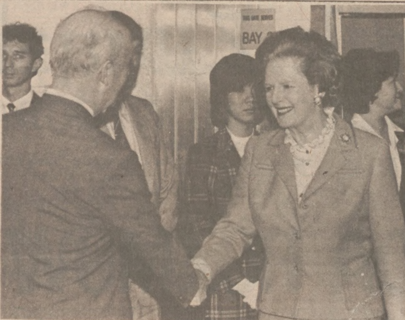
HONGKONG — Premier Wielkiej Brytanii Margaret Thatcher w chwili, gdy przybyła tam 20 grudnia, aby podpisać umowę na mocy której Hongkong powróci do Chin w 1997 r.

Chorzy na AIDS pracownicy szpitalnictwa należeli do grup specjalnego ryzyka np. byli homoseksualistami. Nie należy jednak wyciągać zbyt pochopnych wniosków z historii indywidualnych przypadków zachorowań, chyba że można ustalić bez najmniejszej wątpliwości, że osoba chora na AIDS miała bezpośredni kontakt z chorobą poza terenem szpitala.