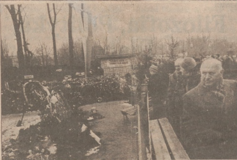
WARSZAWA — Codziennie, tysiące Polaków odwiedza grób śp. ks. Jerzego Popiełuszki, przy kościele św. Stanisława Kostki na Żoliborzu. Grób i tereny okalające go toną w powodzi kwiatów. Zdjęcie zostało zrobione 27 grudnia ub. r.

Liczba pijącej alkohol młodzieży obniżyła się w 1984 roku w porównaniu z rokiem 1983 o 2 procenty. Zmniejszyła się również liczba młodzieży palącej nalogowo papierosy.