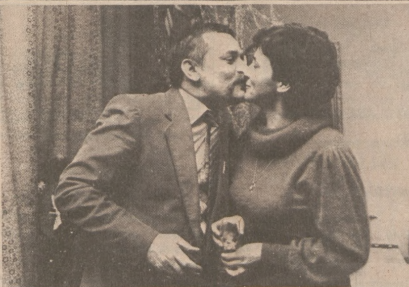
GDANSK — Noworoczny pocałunek państwa Wałęsów. W domu Wałęsów witano w gronie najbliższych przyjaciół Nowy Rok.

Podczas rewizji policja skonfiskowała także 10 funtów marihuany i 2 uncje kokainy w Norridge.