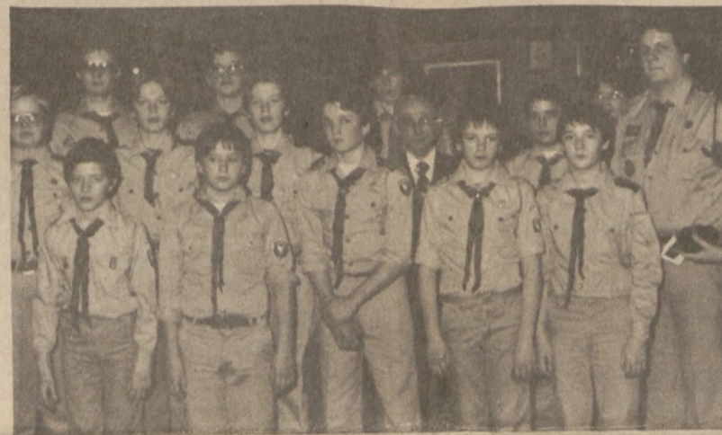
Grupa harcerzy 16 drużyny pancerniej, którzy otrzymali znaki I Dywizji Pancerniej.

W części artystycznej harcerze odegrali bożonarodzeniowe widowisko i