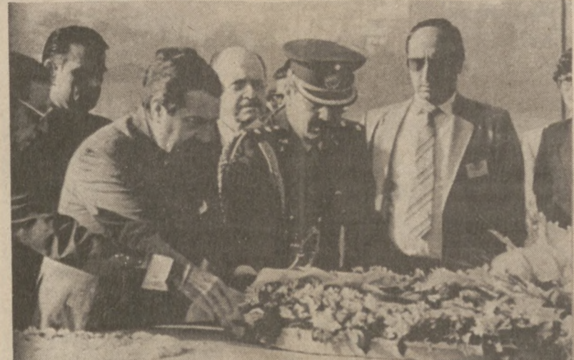
NEW DELHI, INDIE. — W czasie swej wizyty w Indiach prezydent Argentyny Raul Alfonsin złożył wieniec u brzoóg świętej rzeki Yamuna, tam, gdzie spopieleno zwłoki zamordowanej Indry Gandhi.

Dno pływalni ma być wyłożone kafelkami w specjalną mozaikę, która ma przedstawiać twarz słynnego przedwojennego championa.