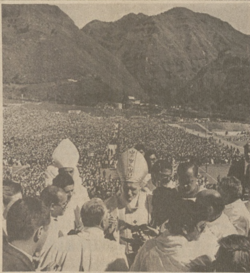
MERIDA, WENEZUELA.—Wstępującego na podium Ojca Świętego witają duchowni wenezuelscy. Papież odprawił tu Mszę św. 28 stycznia br.

Senat podejmie decyzję w tej sprawie dopiero za kilka tygodni, gdy zbierze się na obrady po krótkiej przerwie.