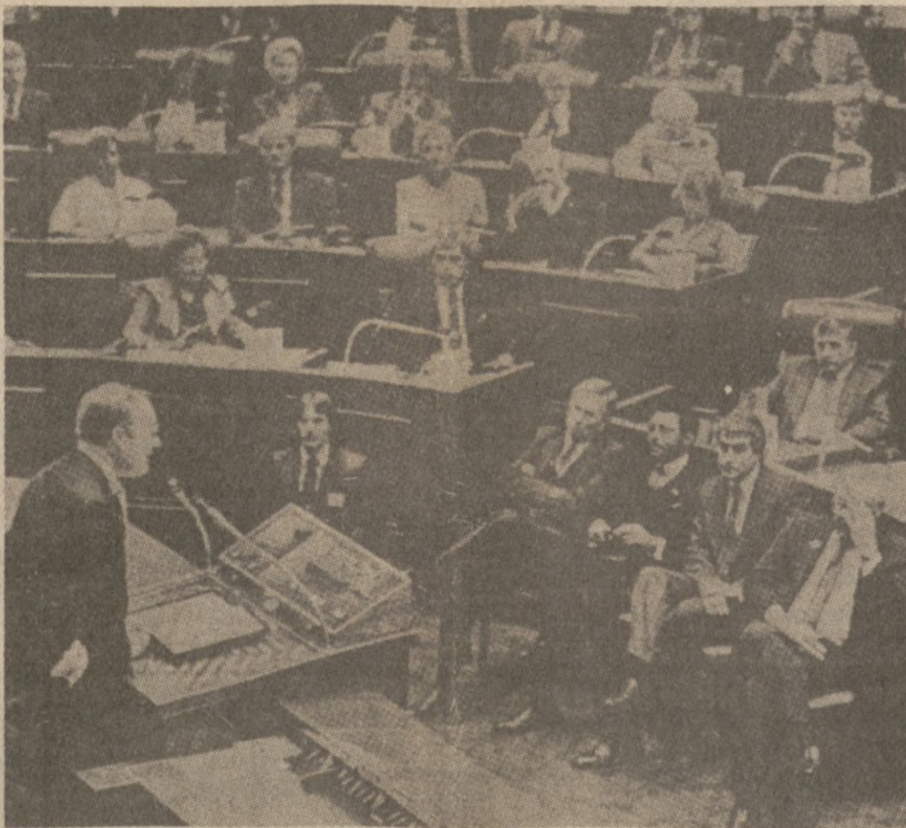
SPRINGFIELD, ILLINOIS.— Ustawodawcy stanowi słuchają przemówienia gubernatora Jamesa Thompsona "O sytuacji Stanu," które wygłosi wczoraj przed Zgromadzeniem Generalnym Legislatury Stanowej.

Oczekuje się, że sąd wyda wyrok pod koniec bieżącego tygodnia.