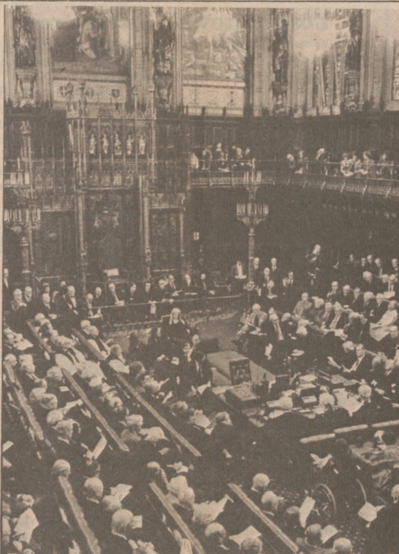
LONDYN.—Sala obrad brytyjskiego Parlamentu. Jest to zdjęcie z transmisji obrad Parlamentu, jakie przekazywano Brytyjczykom w ramach półrocznego eksperymentu, polegającego na bezpośrednim transmitowaniu obrad telewizyjnie.

Jego kariera naukowa została raptownie zakończona w roku 1949, kiedy to został odsunięty od pracy naukowej za przynależność do partii komunistycznej w okresie tzw. ery makkarizmu.