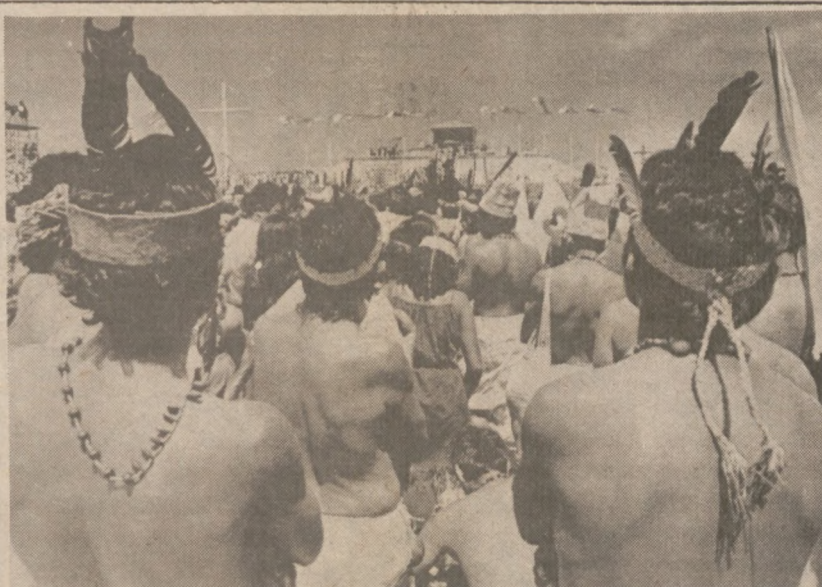
CIUDAD, GUAYANA, WENEZUELA.—Indianie wenezuelscy słuchają Mszy św. odprowadzanej przez papieża Jana Pawła II.