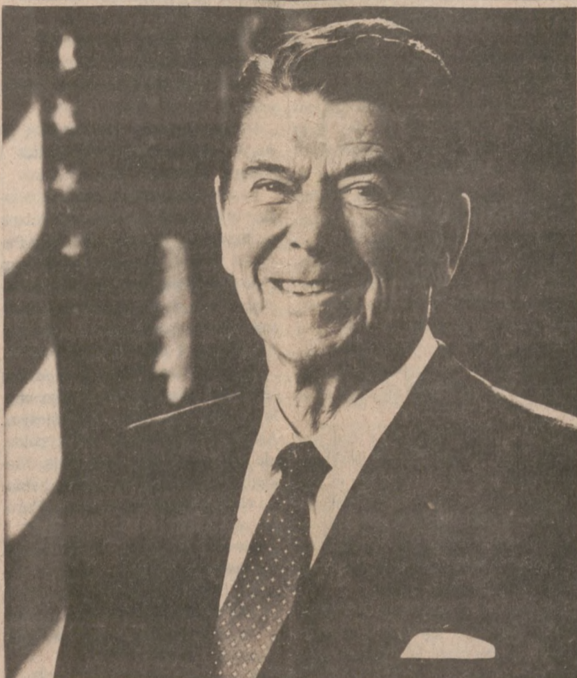
Prezydent Ronald Wilson Reagan

Cena złota spadła w Zurychu o dolara na uncję i wyniosła dziś $302.50; tyleż w Londynie.