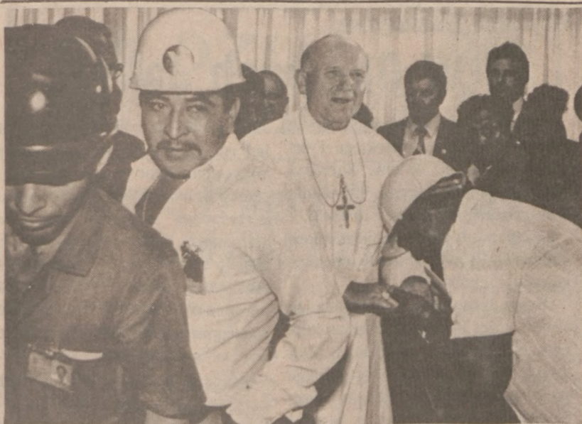
CIUDADA GUAYANA, WENEZUELA.—Ojciec święty w czasie swego pobytu w Wenezueli odwiedził lokalną hutę. Na zdjęciu hutnicy witają się z Papieżem.