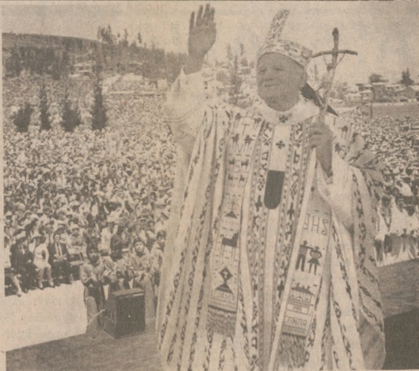
EKWADOR.—Ojciec Święty błogosławi tłumy, które przybyły do Cuenca, aby wysłuchać Mszy św. 31 stycznia br.

Ława przysięgłych będzie rozważać dwie możliwości: ukaranie winnych karą śmierci, bądź dożywotnim więzieniem.