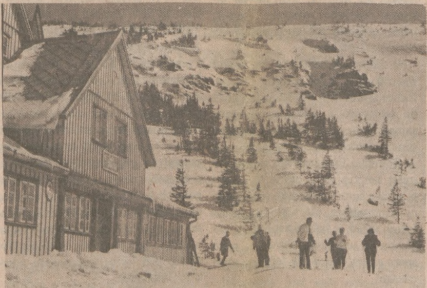
KARKONOSZE. — Schronisko "Samotnia" na Śnieżce.

Z wypowiedzi uratowanego wynika, że frachtowiec zatonął bardzo szybko, dosłownie w 15 minut po przechyleniu się, które spowodowało prze-mieszczenie się ładunku stali.