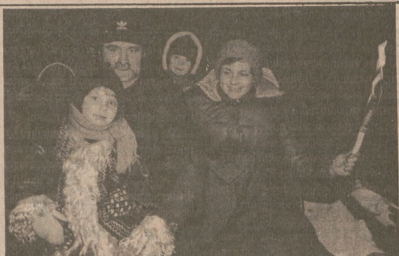
ZAKOPANE.—Państwo Wałęsowie z dziećmi na przejażdżce saniami, w czasie urlopu w Zakopanem.