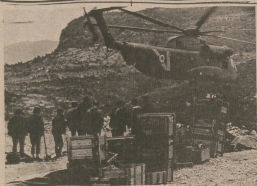
LIBAN. — Żołnierze izraelscy pomagają w ewakuacji swych oddziałów. Na zdjęciu helikopter zabiera sprzęt.

Czy należysz do jednej z polonijnych organizacji bratniej pomocy?