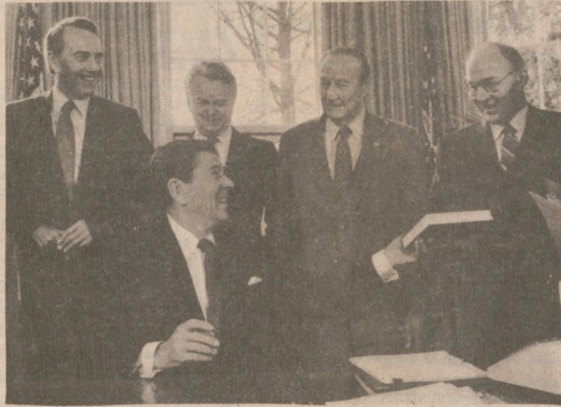
WASHINGTON.—Ceremonialne podpisanie i przekazanie Kongresowi preliminarza budżetowego. Za prezydentem stoją od lewej: przywódca większości w Senacie sen. Robert Dole, przywódca mniejszości w Senacie sen. Robert Byrd; sen. Strom Thurmond i przywódca mniejszości w Izbie kong. Robert Michel.

Pomimo ograniczenia w ostatnich latach pomocy ze strony rządu w dalszym ciągu dostępna jest pokaźna pomoc różnego rodzaju firm, organizacji i związków zawodowych, osób prywatnych i klubów etnicznych. Wobec ogromnych kosztów wiążących się zwykle ze studiowaniem organizacja GPRC zachęca wszystkich zainteresowanych do zwrócenia się po informację w formie pisemnej, na adres: Great Potentials Resource Center, 2529 N. Richmond Str., Chicago, Ill. 60647.