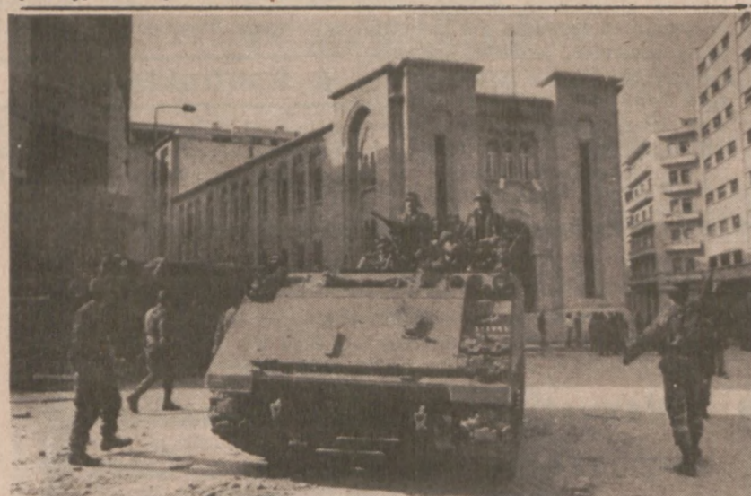
BEJRUT.—Czołgi na ulicach miasta są zjawiskiem dnia codziennego. W głębi, budynek Parlamentu.