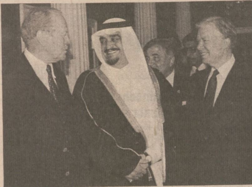
WASHINGTON.—Król Arabii Saudyjskiej Fahd w towarzystwie dwóch byłych prezydentów Stanów Zjednoczonych: Geralda Forda i Jimmy'ego Cartera, w czasie specjalnego spotkania, jakie odbyło się 12 lutego br.

Przed podjęciem decyzji w sprawie systemu 911 zamierza się przeprowadzenie konsultacji z ekspertami z Illinois Bell Telephone Co.