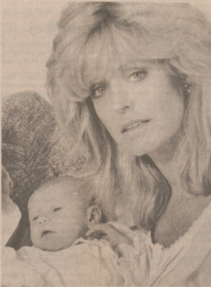
LOS ANGELES. — Znana aktorka Farrah Fawcett z nowo narodonym synkiem Redmondem Jamesem Fawcett O'Neal.

Dziewiętnastu Meksykanów, bez dokumentów, znalazło się w Stanach Zjednoczonych w grupie 400 osób, które uciekły przez granicę w niedzielę. Zbiórka ucieczka nastąpiła po strzelaniu policjantów w czasie politycznego wiecu w Piedras Negras. Strzały padły z tłumu liczącego około 3 tys. ludzi demonstrujących przeciwko sfalszowaniu wyników wyborów miejskich w grudniu ubiegłego roku.