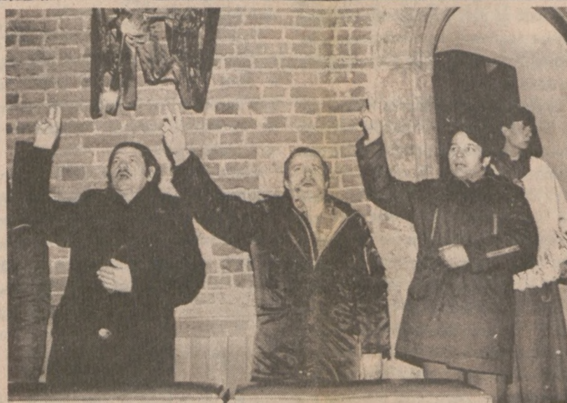
GDANSK.— Lech Wałęsa w czasie Mszy św. odprawianej w kościele św. Brygidy w Gdańsku 18 lutego.

Urzędnik, który prosił o nie podawanie jego nazwiska oświadczył, że Reagan otrzymał ciepłe zaproszenie od rządów kilku państw wschodnioeuropejskich. Przypuszcza się, że są to Rumunia i Węgry.