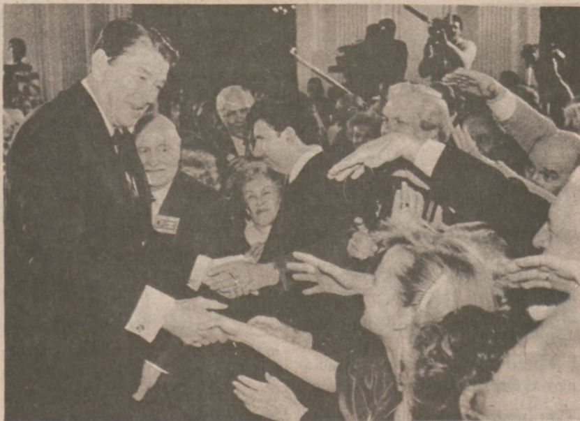
WASHINGTON — Prezydent Reagan oddał hołd wszystkim weteranom, którzy brali udział w bitwie o Iwo Jima przed 40 laty, w czasie specjalnych uroczystości jaka odbyła się w Waszyngtonie. Na zdjęciu Prezydent wita się z uczestnikami spotkania.