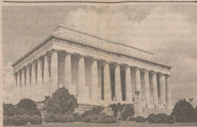
WASHINGTON — Lincoln Memorial.

Wojska wietnamskie przeniknęły na terytorium Tajlandii w pobliżu granicy z Kambodżą.