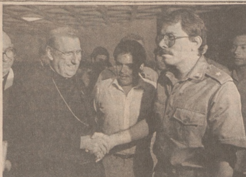
MANAGUA, NIKARAGUA. — Członkowie delegacji duchowieństwa amerykańskiego spotkali się z prezydentem Nikaragui Danielem Ortegą. Na zdjęciu arcybiskup Nowego Jorku John O'connor wymienia uścisk dłoni z prezydentem Ortegą.