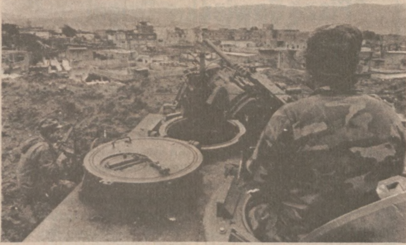
LIBAN — Dwaj żołnierze libańscy na straży przy obozie uchodźców palestyńskich. Przygotowani są na ewentualną interwencję, ponieważ doszło tam do starć.