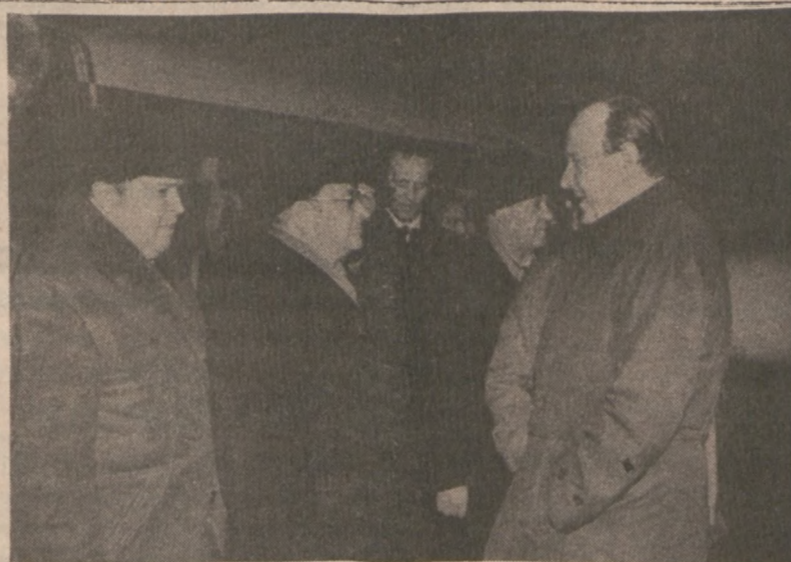
MOSKWA — W Moskwie bawił w wizytę minister spraw zagranicznych Niemiec Zachodnich Hans-Dietrich Genscher. Na lotnisku powitał go zastępca ministra spraw zagranicznych ZSRR G. Kornienko.

Wzrasta też znacznie ilość powołań kapłańskich, których w 1979 r. było 5,845, w tym 1,666 seminarzystów zakonnych, a w 1984 r. — 8,130 (2,765 seminarzystów).