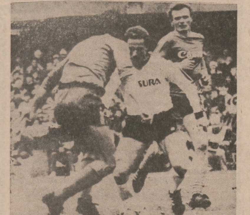
Ostatnio meczem nr 1 serii włoskiej ekstraklasy było spotkanie rewelacyjnego lidera, Verony z wiceliderem Inter Milan. W Weronie padł remis 1:1, co trudno uważać za sukces gospodarzy. Na zdjęciu: fragment spotkania Verona — Inter. Pojedynkę dwóch sławnych piłkarzy reprezentacji Niemiec Zachodnich — Karla Heiza Rumennige, obecnie z Interu (w jasnej koszulce) i Hansa Petera Briegla (odwrócony tyłem).