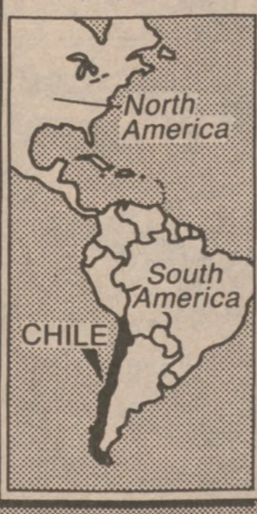
SANTIAGO, CHILE — Mapa ilustrująca tereny dotknięte ostatnim, bardzo silnym trzęsieniem ziemi.

The death toll is high in central Chile after a powerful earthquake struck Sunday causing the collapse of bridges, houses and churches.