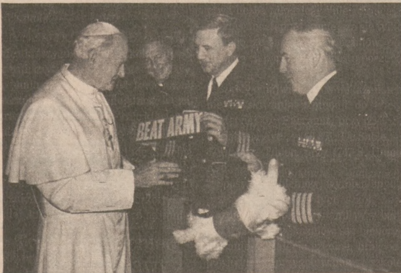
WATYKAN — Kapelani Akademii Marynarki Wojennej U.S. wręczyli Ojcu Świętemu maskotkę szkoły, w czasie audyencji generalnej na początku marca.

Koszta z tytułu odszkodowania mogą wzrosnąć do 29,8 mln dol., jeśli Frank Nelson dożyje wieku lat 75.