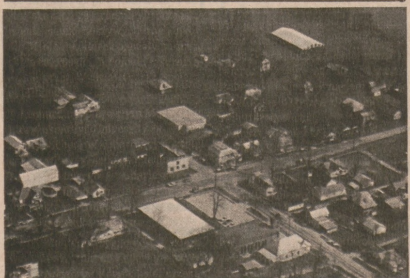
KAMPSVILLE, IL. — Tereny zalane wodami rzeki, która wstąpiła z brzegów.

Pierwszego napadu dokonali oni na 18-letnią dziewczynę w okolicach West Archer Ave., porwali ją, przewożąc ją w jakimś samochodzie tylko znane miejsce, gdzie sotosowali wobec niej "przemoc seksualną". Drugiego ataku dokonali w pobliżu skrzyżowania 43 ulicy i California Ave., porwijając i gwałcąc 23-letnią kobietę.