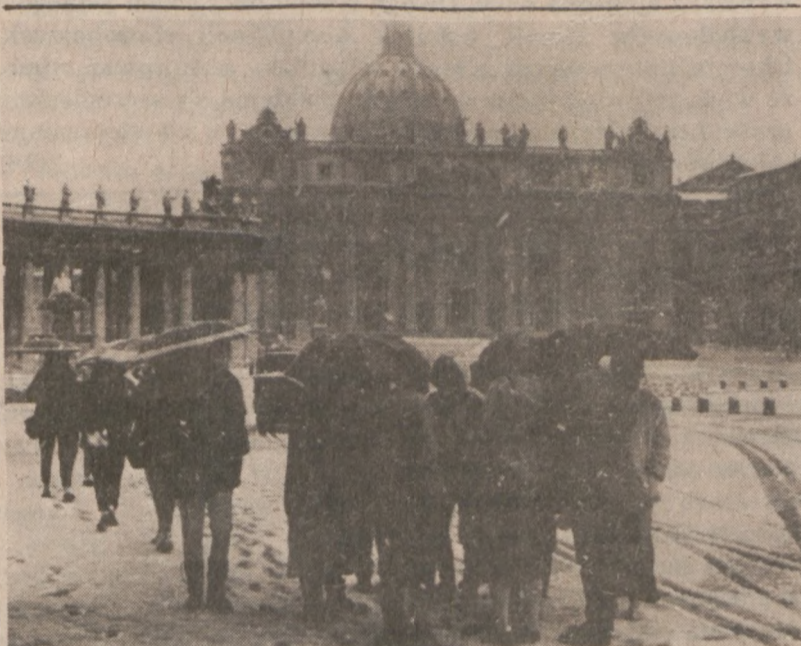
WATYKAN - Pielgrzymi przybywający do Watykanu, zakoczeni zostali śniegiem, który spadł tu 18 marca.

Liczba Żydów, którym władze sowieckie wydały zezwolenia zmniejszyła się drastycznie w ostatnich latach. W ubiegłym roku tylko 908 Żydów opuściło Związek Sowiecki podczas gdy w 1979 roku wyemigrowało ponad 51 tys.