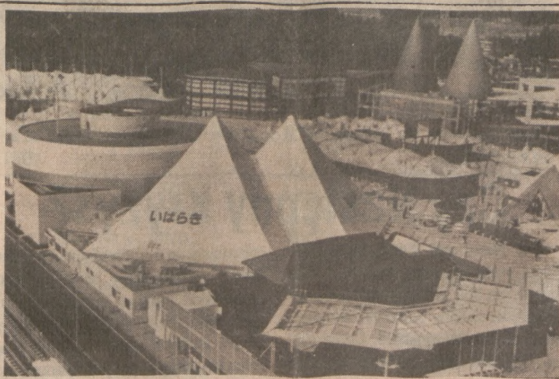
TSUKUBA, JAPONIA. — Fragment miasteczka wystawowego Targów Światowych 1985 r., które rozpoczęły się oficjalnie w sobotę, 16 marca, br.