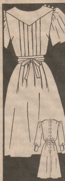
4899 SIZES 8-18

No waist seam. Stitched-down pleats are released into softness beneath sash. Choose fluid fabrics: crepe, georgette, knit.