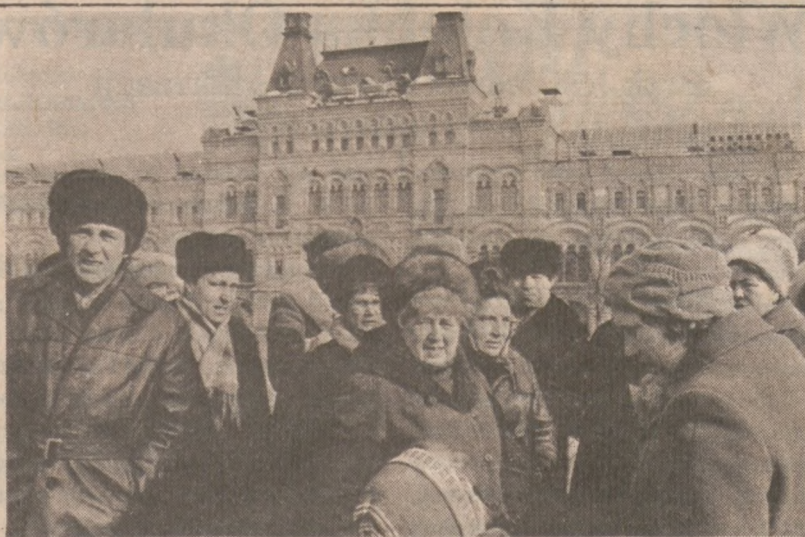
MOSKWA — Mieszkańcy Moskwy zbierają się na Placu Czerwonym.