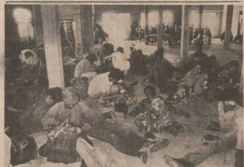
SURIN, TAJLANDIA. — Partyzanci z ugrupowania lojalnego księciu Sihanoukowi czekają na pomoc lekarską. Oskarżyli oni Wietnamczyków o posłużenie się bronią chemiczną w celu pokonania partyzantów.

Ponadto komisja ta miałaby prawo do przeprowadzenia dochodzenia w sprawach wypadków, w których ktoś poniesie śmierć lub ulegnie poważnym obrażeniom.