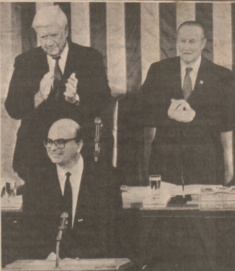
WASHINGTON — Premier Włoch Bettino Craxi, w czasie przemówienia do członków Kongresu U.S. na początku marca bież. roku.

Andrzej Czyszczoń — prezes opr. Zofia Bukowska