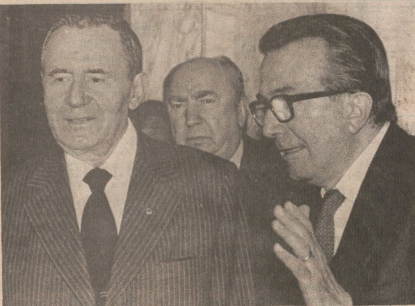
RZYM — Przy końcu lutego, minister spraw zagranicznych ZSRR Andrej Gromyko złożył wizytę we Włoszech. Na zdjęciu w towarzystwie ministra spraw zagranicznych Włoch Giulio Andreotti.

Ustalenia obecne stanowią w tej chwili wszystko, co można było zrobić na razie w tej dziedzinie. — Jest to w każdym razie więcej — powiedział De Vault — niż to, czym dysponowaliśmy dotychczas.