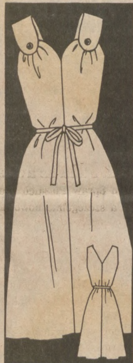
4962 SIZES 10½-24½

Sew-easy: no waist seam, no fuss, just free, floating lines from bra-covering straps to hem. Wear with or without waist tie. Printed Pattern 4962: Half Sizes 10½ to 24½. $3.00 for each pattern. Add 50¢ each pattern for postage and handling. Send to: Anne Adams Patterns, 10 Reader Mail