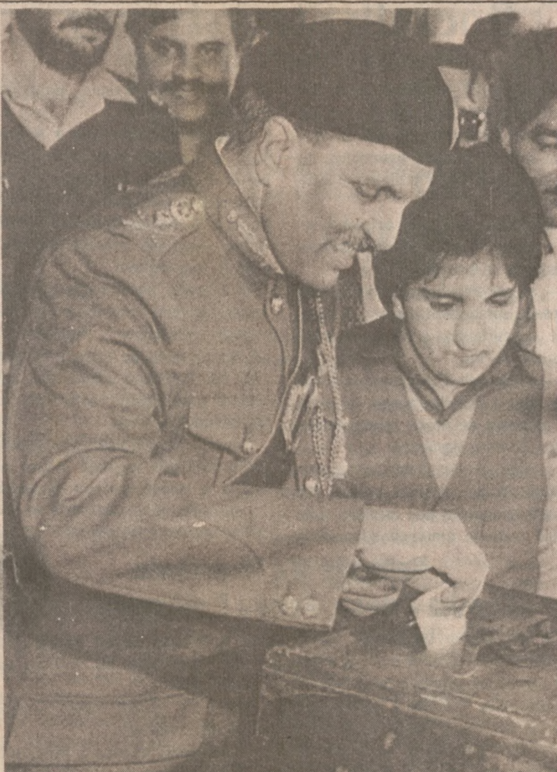
PAKISTAN — Prezydent Mohammad Zia-ul-Haq głosi w czasie wyborów jakie się tu odbyły pod koniec lutego.

Liczba wynosząca od 2.2 do 2.3 mil. aut — ustanowiona przez ministerstwo — stanowi i tak wzrost w stosunku do stanu obecnego w wys. około 25 proc. W dolarach — wzrost ten wynosi około 3 bil. dol.