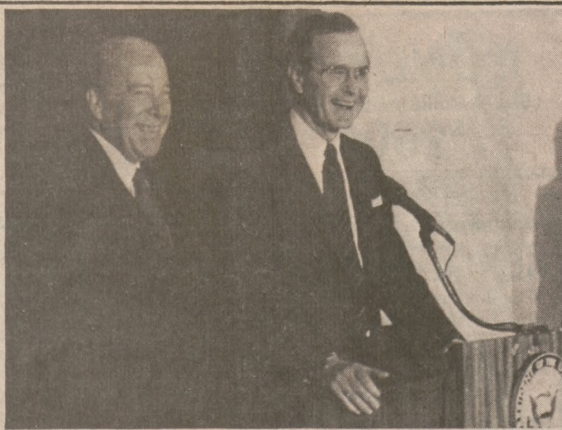
MOSKWA — Wiceprezydent George Bush i sekretarz stanu U.S. George Shultz odpowiadają na pytania dziennikarzy w czasie konferencji prasowej jaka odbyła się po spotkaniu z Gorbaczowem, 13 marca br.