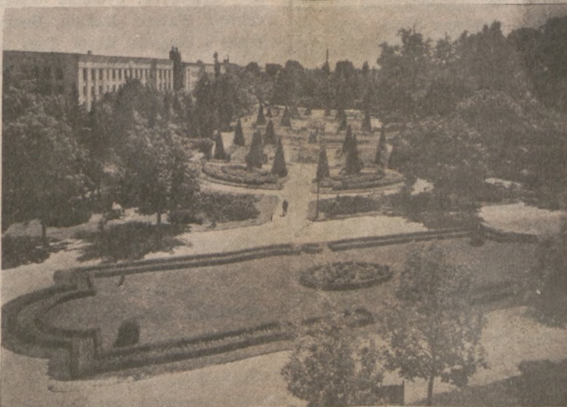
BIAŁYSTOK. — Park miejski.

Czterech z zabitych zidentyfikowano, jako członków partyzanckiej organizacji pod nazwą "Tamil Eelam." Partyzanci walczą o utworzenie niezależnego i odrębnego państwa w północnych i wschodnich regionach Sri Lanki, gdzie większość etniczną stanowią Tamilowie.