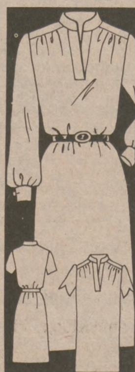
4576 SIZES 8-20

Belt-or-not chemise is a winner for work or weekends in pima cotton (consider a shirting stripe). Sleeveless version also. Printed Pattern 4576. Misses Sizes 8 to 20. $3.00 for each pattern. Add 65¢ each pattern for postage and handling. Send to: Anne Adams Patterns, 10 Reader Mail