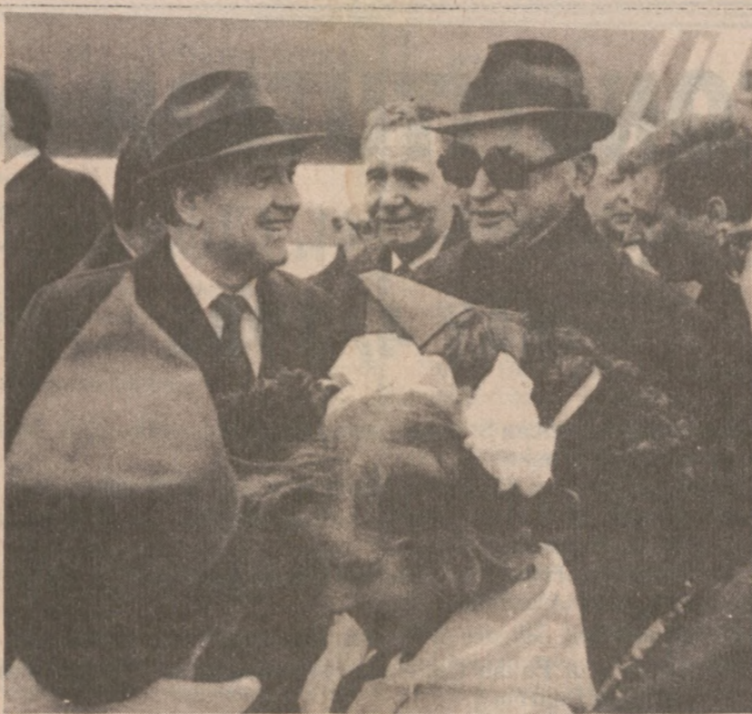
WARSZAWA — Na lotnisku Okęcie Michaiła Gorbaczowa przybywającego tu na konferencję przedstawicieli państw Układu Warszawskiego, przywitał Wojciech Jaruzelski.

Nowy sekretarz pracy opierając się na danych Departamentu Handlu powiedział, że ponad 20 tys. firm amerykańskich wytwarza swoje produkty znacznie taniej niż inne zakłady na świecie. Pomimo to, firmy te nie eksportują swoich wyrobów.