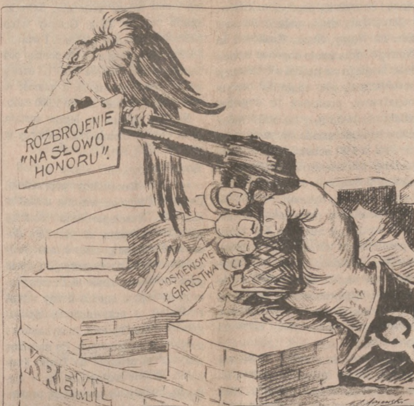
Powyższy rysunek Kazimierza Majewskiego ukazał się w “Dzienniku” po raz pierwszy w listopadzie 1964 r. Jak widać nadal jest aktualny.