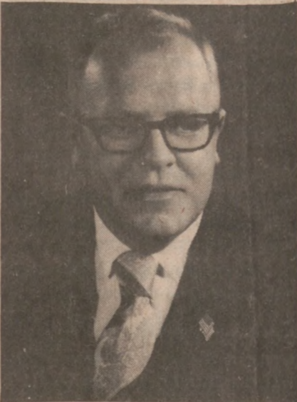
Radca Edward J. Derwiński

Chicago (Inf. wł.) — w niedzielę, po uroczystej Mszy św., jaka zostanie odprawiona w kościele św. Trójcy (o godz. 10:00 rano) z okazji 194 rocznicy uchwalenia Konstytucji 3 Maja, przemówienie po angielsku do zebranej Polonii wygłosi długoletni nasz przyjaciel, wybitny ustawodawca przez 24 lata, obecnie radca Departamentu Stanu b. kongr. Edward J. Derwiński. Kongr. Edwarda J. Derwińskiego znamy od wielu lat, szczególnie, gdy prawie co roku wraz z Polonią uczestniczył w paradach 3-Majowych, idąc na czele Podhalan, w tradycyjnym stroju góralskim.