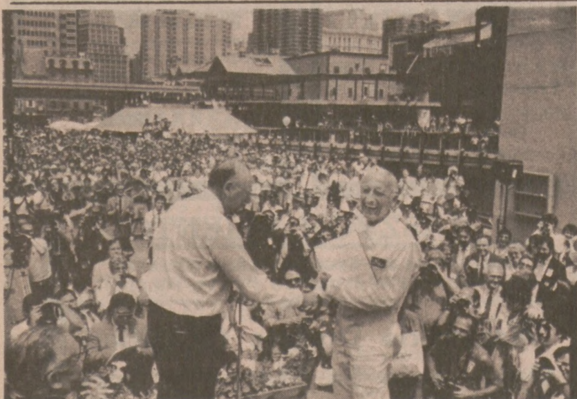
NOWY YORK—Mayor Ed Koch wita kapitana Jacquesa Cousteau przed budynkiem muzeum Morskiego.

Oskarżona, Adrienne Koulouris, przebywa w areszcie.