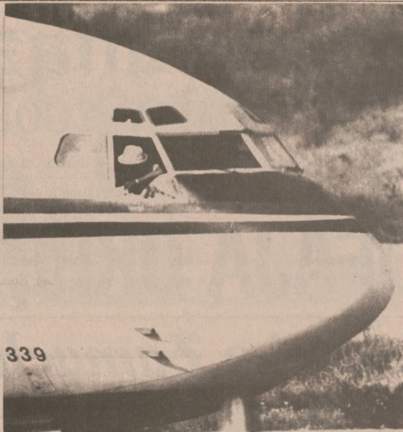
BEJRUT—Terrorysta wyglądający z okna kabiny pilotów porwanego samolotu TWA.