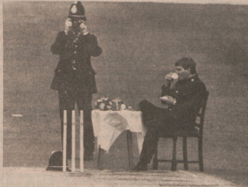
LEEDS, WIELKA BRYTANIA—Dwaj policjanci wyznaczeni do pilnowania porządku na stadionie, odpoczywają podczas przerwy na lunch.

Pokaz Filmów Rozpoczyna Sie o Godzinie 6:30 Wiecz. Kino PATIO Otwarte o 6 Wiecz.