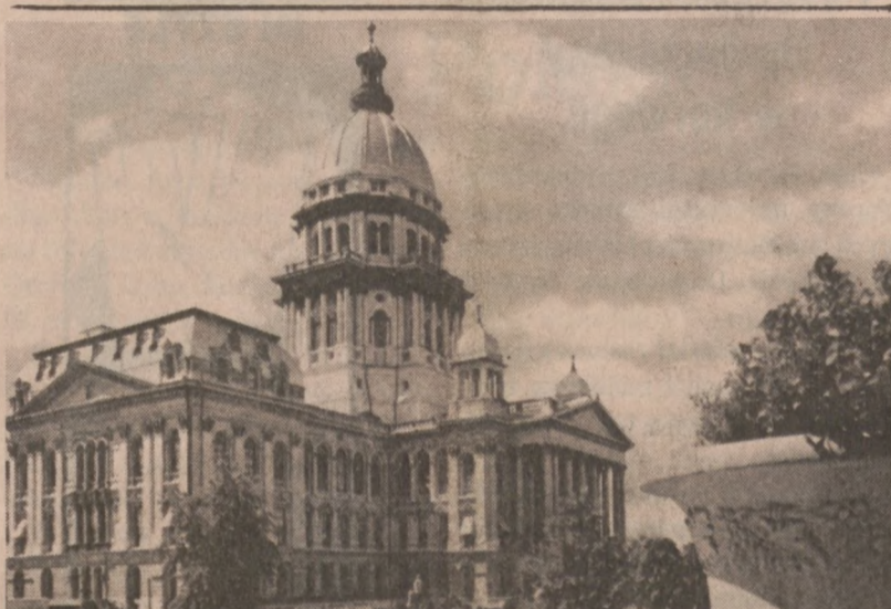
SPRINGFIELD, ILL. — Budynek Kapitolu w stolicy stanu Illinois.

W tym samym czasie opozycyjna Demokratyczna Partia Socjalistyczna wystąpiła do konferencji episkopatu Nikaragui o wstawienie się do władz w sprawie dwóch działaczy aresztowanych dwa tygodnie temu z oskarżenia o "kontrewolucyjną aktywność." Obaj zostali zatrzymani 15 czerwca, w dzień po powrocie z Rzymu nowo mianowanego kardynała Obando y Bravo.