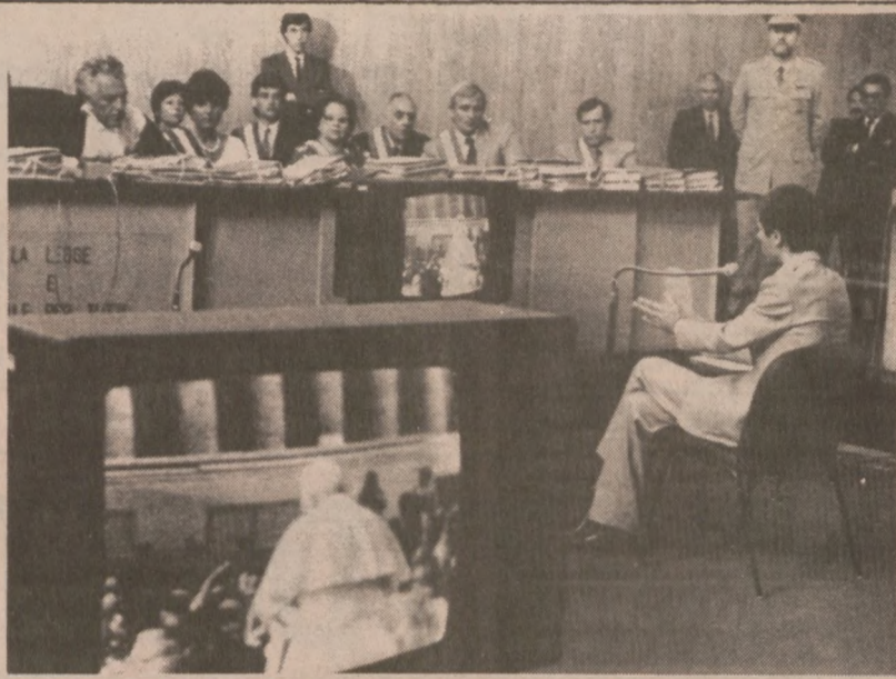
RZYM—Mehmet Ali Agca podczas przesłuchania przed sądem. Agca postrzelił w 1981 roku na Placu św. Piotra w Rzymie Papieża Jana Pawła II.