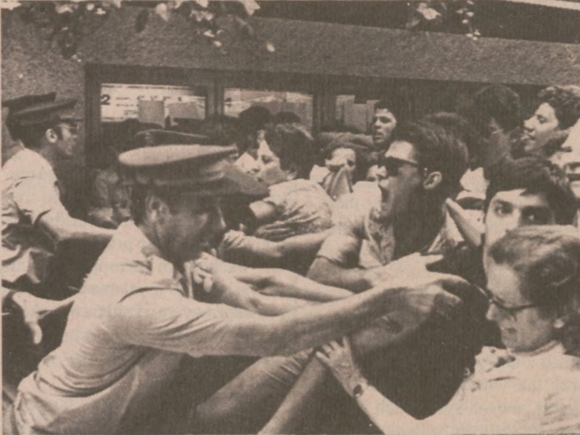
MADRYT.— Hiszpańscy katolicy w starciu z policją, protestują przeciwko wyświetlaniu filmu "Je Vous Salue Marie" ("Zdrowaś Mario") reżyserii Jean-Luc Godarda. Policja aresztowała kilkanaście osób, które zablokowały wejście do kina.