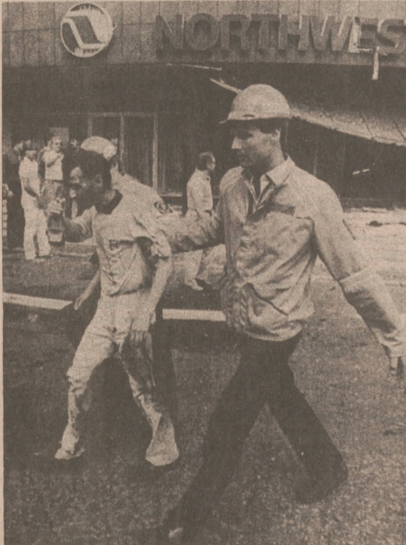
KOPENHAGA, DANIA. — Jedna z ofiar, ranny w zamachu bombowym na biura linii lotniczych Northwest Orient, w drodze do karetki pogotowia.

W roku 1973 Liberia wydalila sowieckiego ambasadora, który został oskarżony o mieszanie się w sprawy wewnętrzne ZSSR w odpowiedzi również usunął ambasadora Liberii.