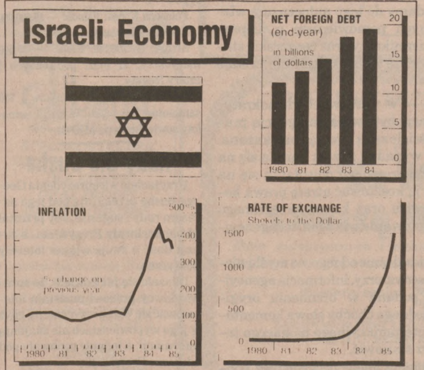
IZRAEL — Wykresy ilustrujące sytuację ekonomiczną Izraela. Skarb państwa jest pusty, rośnie zadłużenie, zmniejszają się też rezerwy.

Ponad 50 tys. razy w ciągu roku następują trzęsienia ziemi w różnych miejscach kuli ziemskiej.