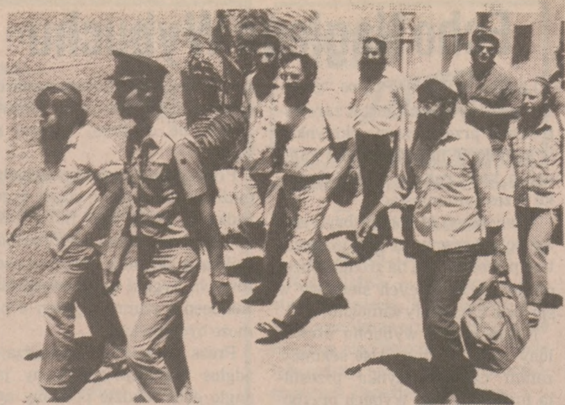
JEROZOLIMA — Członkowie żydowskiej organizacji terrorystycznej w drodze do gmachu sądowego, gdzie zostaną ogłoszone wyroki. Trzech członków tej grupy skazanych zostało na dożywocie.

Z informacji podanej przez NRD-owską agencję prasową wynika, że oboje Niemcy przyjechali do Niemiec Wschodnich pod pretekstem odwiedzenia rodziny. Zamiast tego, zorganizowali oni "co najmniej 24 tajne spotkania" z łącznikami z Niemiec Wschodnich.