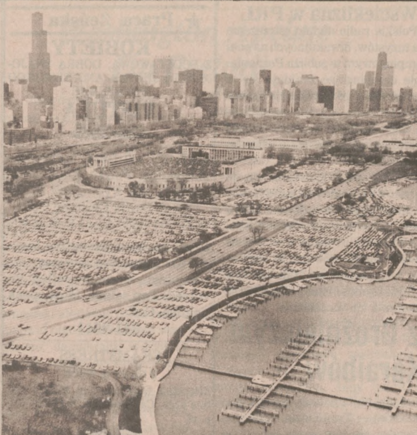
CHICAGO — Widok miasta od jeziora w kierunku północnym.