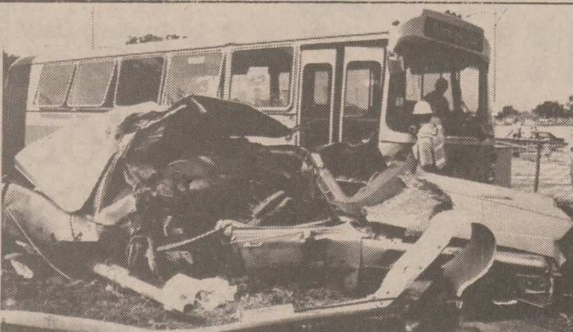
CHICAGO — Wrak "Cadillaca", który został zmiążdżony przez autobus CTA na Lake Shore Drive. W katastrofie śmierć poniosło 7 młodych pasażerów samochodu.