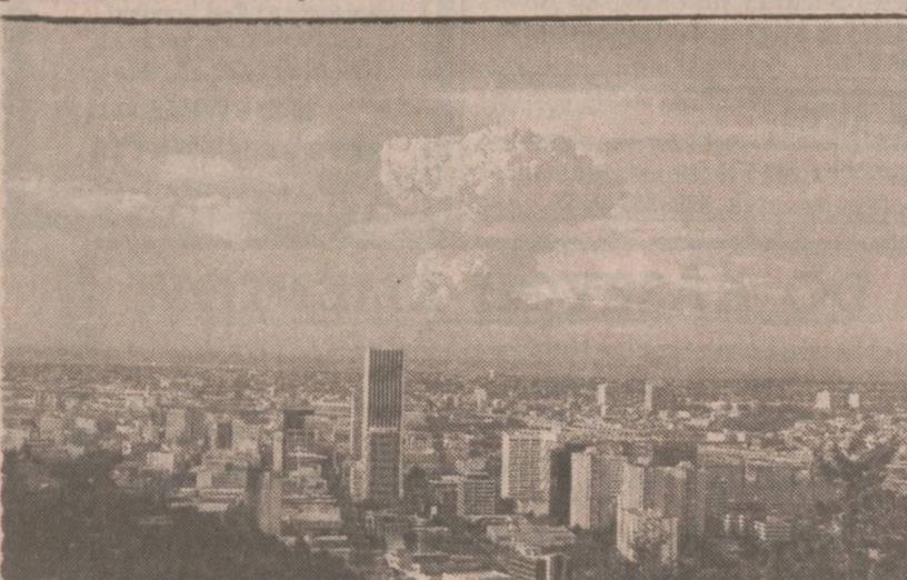
PORTLAND, OREGON. — Widok miasta i Mt. St. Helens. Zdjęcie zrobione w czasie wybuchu tego wulkanu 22 lipca 1980 roku.