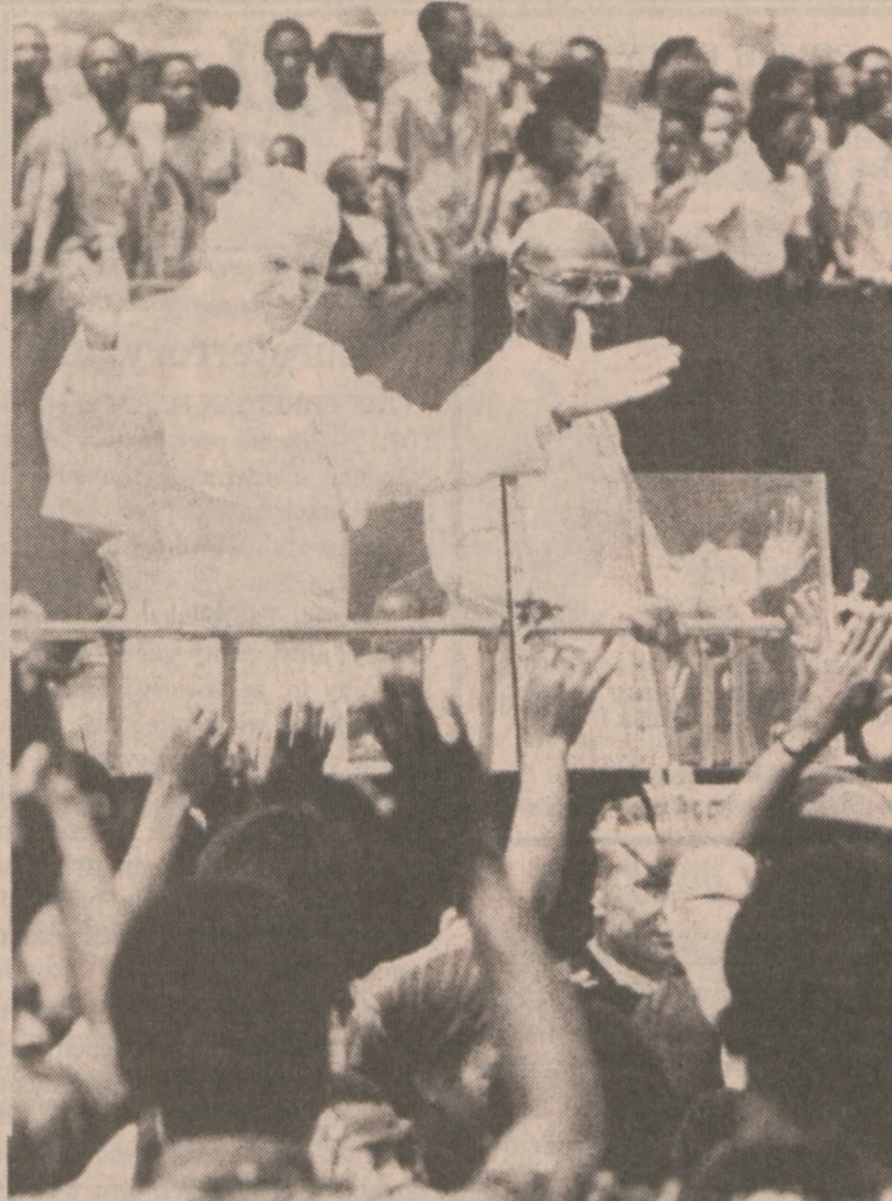
KINSZAS, ZAIR — Papież Jan Paweł II w towarzystwie kardynała Maluli, arcybiskupa Kinszas, pozdraiwia witający go tłum.

Po informacji proszę dzwonić — 793-5954.