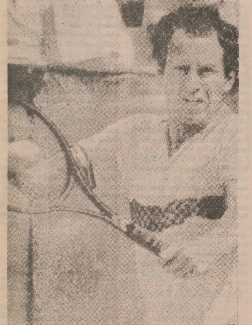
Wielce kontrowersyjny, ale doskonały gracz w tenisa — John McEnroe pokonał w finałowym spotkaniu swego najgroźniejszego rywala — Czechosłowaka Ivan Lendl.

Dużo innych artykułów po okazjnie niskich cenach, które nie są ogłaszane. Wygodne i praktyczne DAMSKIE BLUZECKI bez rękawów Jednobarwne i kolorowe; wycięcie w szpic Rozm. S-M-L- 1/2 CENY Na sezon jesienno-zimowy KOŁDRY Dacron/Bawełniane pokrycie Pojed. 72 x 84" Reg. $29.95 $19.99 Podwójne i "Queen" 80 x 90 Wart. $34.99 $23.99 Damskie KOSTIUMY KAPIELOWE znanych firm 1/2 CENY Wybielacz CLOROX 1 galon Wart. $1.40 79c Jeśli masz rodzinę w Polsce oszczędź 1/4 lub więcej na wielkiej wyprzedaży: * mydła * pasty do zębów * ubrania * ręczniki * bluzy * dżiny * wszystkie artykuły na wyprzedaży w basemencie Jeśli cokolwiek chcesz, a nie widzicie, prosimy pytać się naszych sprzedawców.