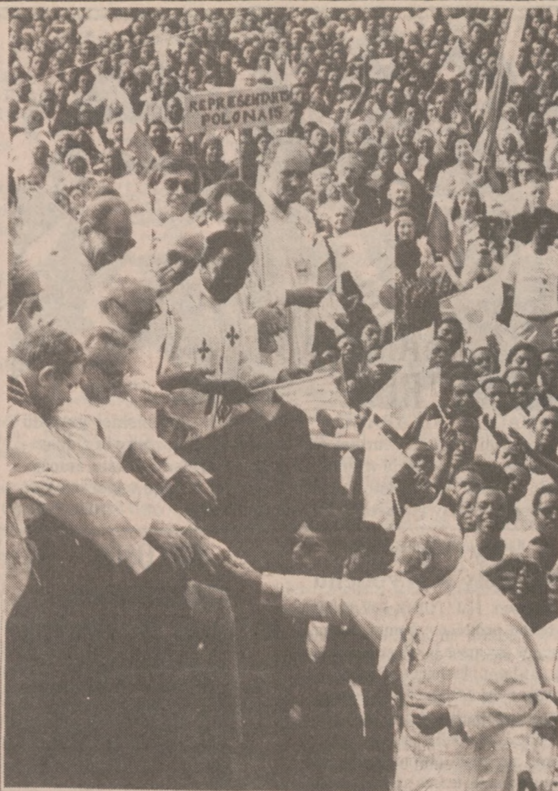
KINSZAS, ZAİR — Księża starają się uściskać dłoń Papieża Jana Pawła II, który przybył, aby odprawić Mszę św w pałacu Ludowym. Podczas Mszy św. Papież beatyfikował siostrę Anuarite Nengapeta

Władze wojskowe podały do wiadomości, że odcięty do mieszkania zajmowanego przez ustawodawców dopływ prądu, wody, jak również połączenie telefoniczne.