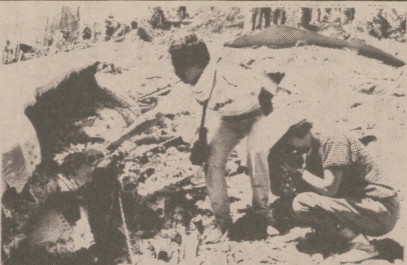
OSUTAKA, JAPONIA — Rodziny ofiar samolotu Japońskich Linii Lotniczych modlą się przy wraku Boeinga 747.

Polska szkoła sobotnia im. Gen. K. Pułaskiego wypracowała metody i formy organizacyjne, które winny być