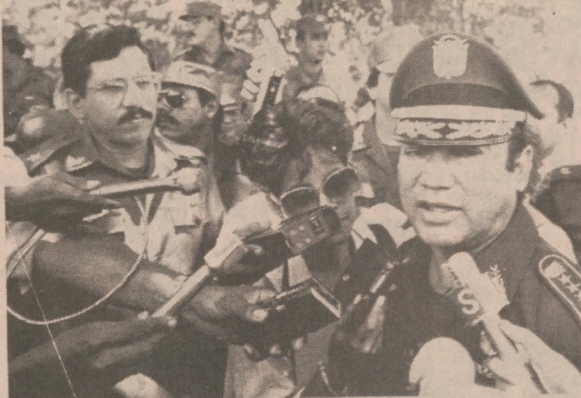
MANAGUA, NIKARAGUA — Dowódca panamskiej gwardii narodowej, generał Manuel Antonio Noriega rozmawia z dziennikarzami po złożeniu wieńca na grobie Carlosa Fonseci, założyciela Frontu Sandinistowskiego. Po lewej stronie widoczny jest minister obrony Nikaragui Humberto Ortega.

Zdobycie zespołowo Pucharu Narodów, Grand Prix i pierwszych miejsc w trzech innych konkursach — to sukcesy, na które nie liczyl nawet najwięksi optymiści.