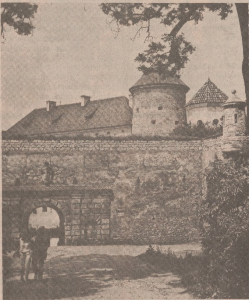
OJCÓW — Fragment zamku w Pieskowej Skale.