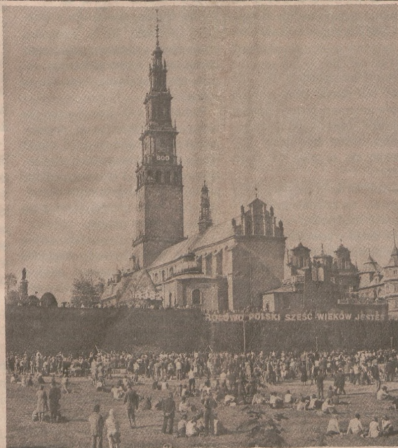
CZĘSTOCHOWA — Klasztor Jasnogórski.

Ostatnio w polskich mass mediach coraz częściej są ataki na Kościół oskarżony o "mieszanie się do polityki". Kardynał odrzucił zdecydowanie takie insynuacje stwierdzając, że Kościół ma jedynie obowiązek uczestniczenia w dialogu dotyczącym najżywniejszych interesów narodowych.