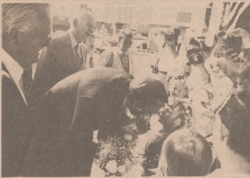
CHICAGO — Dzieci z polskiej szkoły im. gen. Pułaskiego przywitały Gubernatora przed domem Okręgu XIII ZNP.