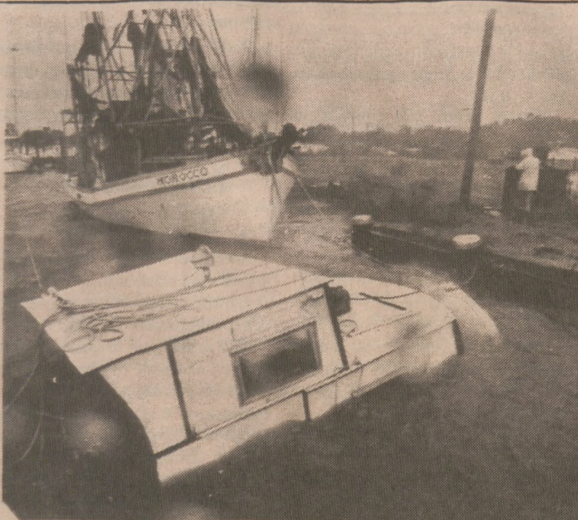
DELCAMBRE, LA. — Kuter zatopiony przez huragan Danny w Kanale Delcambre.