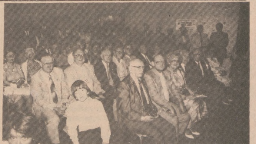
CHICAGO — Na uroczystość podpisania ustawy stanowej o Dniu gen. Pułaskiego, przybyło bardzo wielu przedstawicieli organizacji polonijnych. Na zdjęciu fragment sali i uczestnicy ceremonii, która odbyła się w czwartek, 22 sierpnia br.