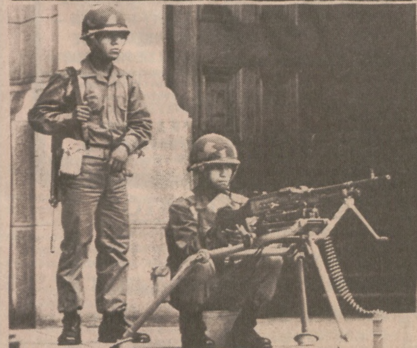
LIMA, PERU. — Uzbrojeni po zęby żołnierze strzegący pałacu rządowego w centrum miasta.

W związku z opisaniem zajściem Princevac, który jest imigranem z Jugosławii, skazany został przez sąd na rok nadzoru sądowego.