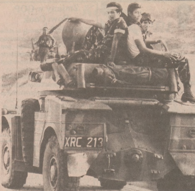
CHALATENANGO, SALWADOR. — Żołnierze armii salwadorskiej gotowi do patrolowania dróg, po atakach lewicowych rebeliantów.

Badania przeprowadzone będą w ośrodku Family Practice Center, 2751 W. Winona St. W sprawie umówienia się można telefonować pod numer 989-3806.