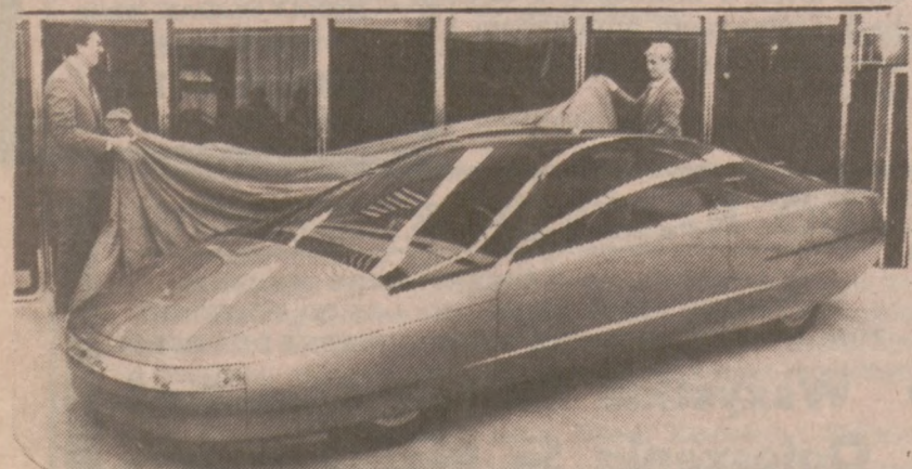
DEARBORN, MICH. — "Probe V" nowy model Forda o aerodynamicznych kształtach, wystawiony w ośrodku wystawowym firmy.

W sobotnim ciągnięciu Loterii Stanowej w grze "Lotto" padły następujące numery: 15, 17, 19, 22, 34, 36