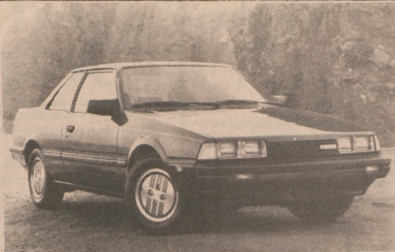
DETROIT — Samochód Mazda 626, model 1986, cena 8,845 dol.

Założony przez T.G. Hiebert, Ph.D. i M.D. wymieniony Instytut przygotowuje lekarzy do bardziej obiektywnego i fachowego badania w sprawach wnioskowo "Workers Compensation", Social Security, oraz utraty, lub ograniczenia zdolności w następstwie wypadku. (R.M.)