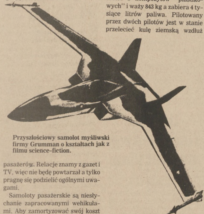
Przyszłościowy samolot myśliwski firmy Grumman o kształtach jak z filmu science-fiction.

Samolot braci Rutan wykonany został z kompozytów "plastikowych" i waży 843 kg a zabiera 4 tysiące litrów paliwa. Pilotowany przez dwóch pilotów jest w stanie przelecieć kulę ziemską wzdłuż