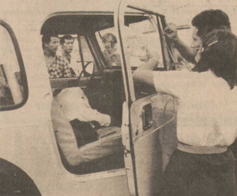
SAN SALVADOR, SALVADOR. — Specjaliści policji szczegółowo badają samochód z którego porwano córkę prezydenta Duarte — Inez. Kobiętę porwano 10 września br. Porywacze zastrzelili strażnika, chroniącego porwaną.

Ponadto, nowe prawo gwarantuje, iż podatki od elektryczności i gazu nie wzrosną automatycznie po tym, jak Stanowa Komisja Handlowa zatwierdzi podwyżki opłat za energię.