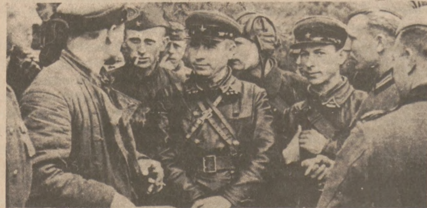
WRZEŚNIEN — 1939 r. — W pobliżu Brześcia Litewskiego spotkały się wojska sowieckie i niemieckie.

W rezultacie tych obu agresji, pod koniec września 1939 na obszarach