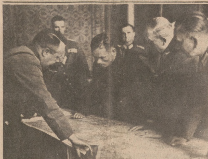
Najeżdźcy na Polskę we wrześniu 1939 r. — oficerowie niemieccy i sowieccy w Brześciu nad Bugiem studiują mapę. Dzisiaj mija rocznica zdradzieckiej napaści na Polskę oddziałów Armii Czerwonej, 17 września, 1939 r. (Zdjęcie archiwalne)

Prowadzone w Trypolisie walki określane są jako najbardziej zacięte ze wszystkich, jakie toczyły się w tym mieście w okresie ostatnich dwóch lat.