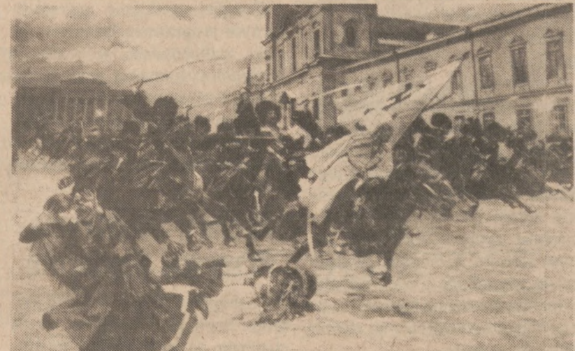
Wojciech Kossak — "Szarża Czerkiesów na Krakowskim Przedmieściu".

Wystawa z okazji piątej rocznicy Gdańskiego Sierpnia jest o wiele skromniejsza. Ot, kilka pism "Solidarności", dokumentów, kilkanaś-