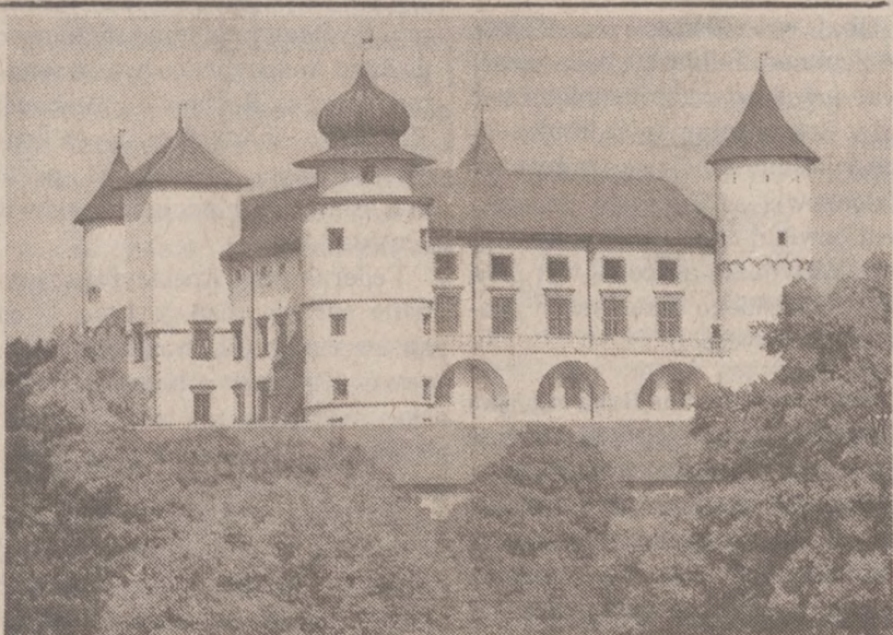
WIŚNICYZ — Zamek, wzniesiony na zalesionym wzgórzu, zbudowany w początku XVI w. dla rodziny Kmitów. Obecnie w zamku tym znajduje się muzeum.

Arafat zaprzecza wszelkim podejrzaniom, że Organizacja Wyzwolenia Palestyny była w jakikolwiek sposób zamieszana w terrorystyczną akcję uprowadzenia "Achille Lauro".