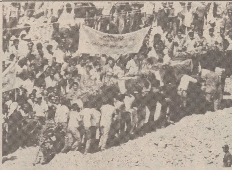
TUNIS — Pogrzeb ofiar bombardowania.

Mitterrand złożył wieniec dla uczczenia śmierci tych, którzy zginęli uciekając przez "berliński mur." Następnie złożył wizytę w ratuszu, wpisał się do "Złotej księgi gości" i obejrzał francuską defiladę wojskową.