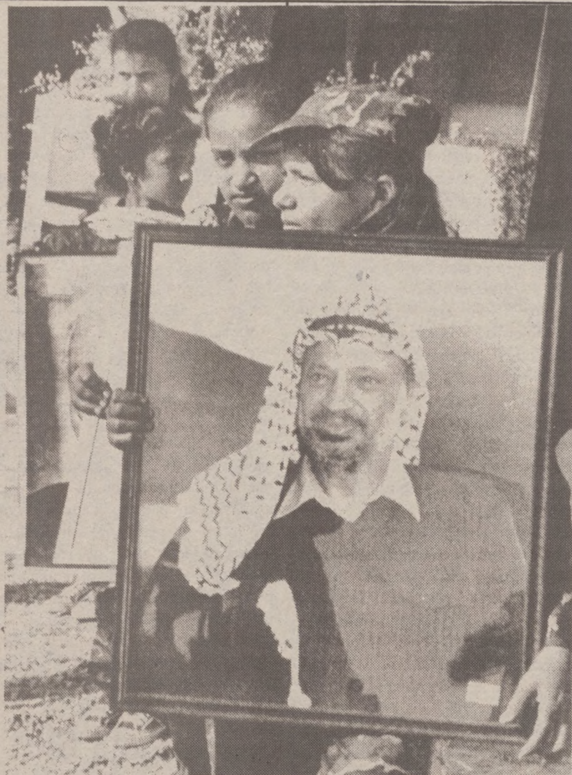
TUNIS — Młodzi członkowie PLO z portretem Arafata, w kondukcje pogrzebowym ofiar bombardowania Izraelczyków.