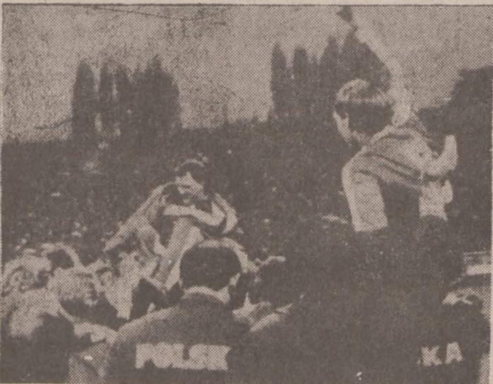
Po zakończonym bezbramkowym spotkaniu z Belgią trener Antoni Piechniczek i Roman Wójcicki na ramionach rozentuzjowanych kibiców. Wynik tego meczu zakwalifikował reprezentację Polski do "Mundialu-86" w Meksyku.