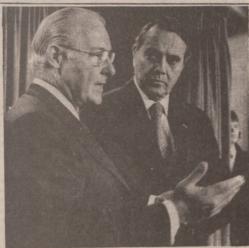
WASHINGTON — Przywódca większości w Senacie U.S. sen. Bob Dole i przywódca mniejszości w Izbie Reprezentantów kongr. Robert Michel w czasie konferencji prasowej poświęconej sprawom związanym z reformą podatkową.

W osiedlu murzyńskim Soweto policjanci zastrzelili 15-letniego Murzyna.