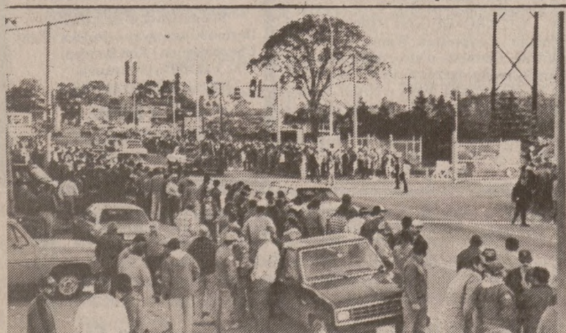
SEABROOK, N.H. — Dziki, niepopierany przez związki zawodowe, strajk pracowników budowy elektrowni atomowej wybuchł 15 października. Na zdjęciu strajkujący przed bramą elektrowni. "To sprawa ludzkiej godności" — mówią robotnicy — "Zaczęto nas traktować niczym zwierzęta."

"Czerwony oddział" podobno nielegalnie szpiegował działaczy politycznych i organizacje na czele których stali.