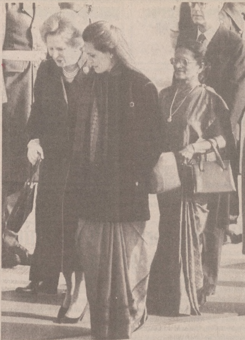
LONDYN — Margaret Thatcher wykonała znaczący gest udając się na lotnisko Heathrow w Londynie by powitać premiera Indii, Radżiwa Ghandiego. Na zdjęciu: w rozmowie z Sonią Ghandii, żoną premiera.

"To nie jest bynajmniej jedyny przypadek łamania postanowień podpisanych traktatów" — powiedział Weinberger — "Podobnie ma się sprawa z sowieckimi urządzeniami wykrywającymi, w tym głównie z wielkim radarem w pobliżu Krasnojarska. Jest to rażące złamanie układu ABM z roku 1972, który zakładał, że podobne urządzenia mogą być instalowane wyłącznie wzdłuż granic państw-stron układu i spełniać rolę detektorów systemu wczesnego ostrzegania."