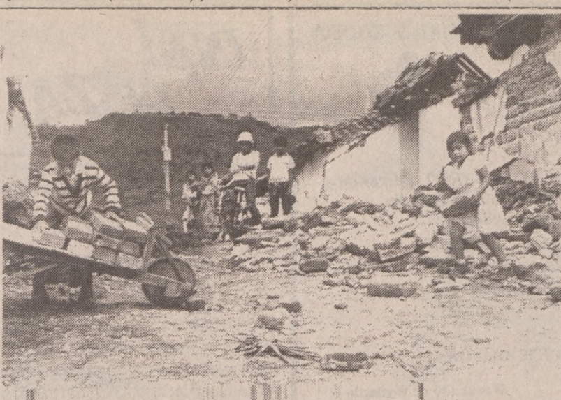
MEKSYK — Usuwanie skutków trzęsienia ziemi w jednej z meksykańskich wiosek nawiedzonych w ostatnim okresie czasu powtórny trzęsieniem ziemi, tym razem o sile 7 stopni w skali Richtera.

Impreza jest traktowana, jako główne źródło przychodu dla parafii.