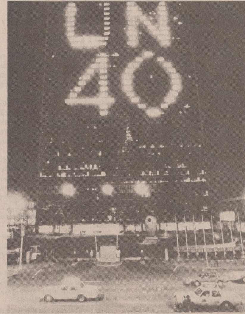
NOWY YORK — Budynek Sekretariatu Organizacji Narodów Zjednoczonych odpowiednio oświetlony, w 40-tą rocznicę powstania tej organizacji.