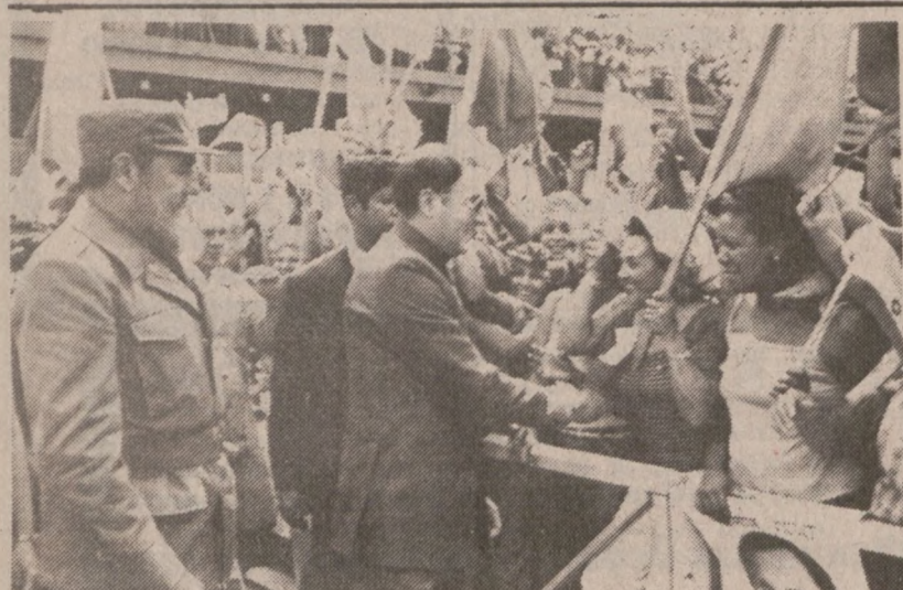
HAWANA, KUBA. — Przed przyjazdem do Stanów Zjednoczonych premier Indii Rajiw Gandhi złożył wizytę na Kubie. Na zdjęciu serdeczne przywitanie Premiera, któremu towarzyszy Fidel Castro.

Na sesję przybyli również przedstawiciele takich organizacji, jak Fund for Animals i Citizens for Animal Rights.