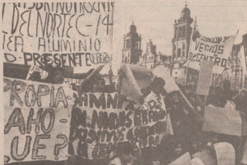
MEXICO CITY, MEKSYK — Ponad 4000 osób, poszkodowanych w ostatnim trzęsieniu ziemi demonstrowało 29 października domagając się szybszej pomocy w odbudowaniu zniszczeń. (UPI)

Thompson powiedział, iż porzucił już nadzieje przyłączenia się do delegacji, która rozpoczęła podróż na Dalekim Wschodzie. Oznajmił on, iż najprawdopodobniej przełoży swą wizytę handlową w Korei i Japonii na styczeń, przyszłego roku.