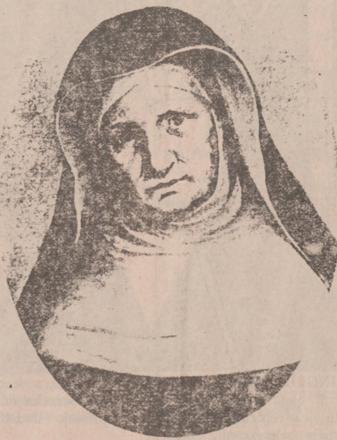
MARY THERESA OF JESUS GERHARDINGER

17 Listopada Papież Jan Paweł II Wyniesie Matkę Marię Teresę Na Ołtarze