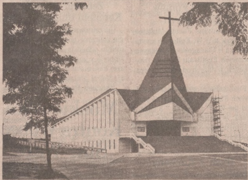
NOWA HUTA-MIERZEJOWICE. — Kościół pod wezwaniem św. Maksymiliana Marii Kolbego.

Najbardziej dotknięte zostały powodźmi stany Wirginia, Wirginia Zachodnia, Pensylwania, Maryland i Karolina Północna.