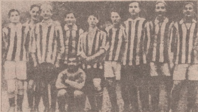
Stara Polonia — 1912 rok.

Dziwny to klub ta stołeczna Polonia. Wiele organizacji sportowych w Polsce postarza się, wywodzą swe rodowody nawet od tych, co kopali lanke (pełna piłeczka gumowa o średnicach od 2 do 5 cm, wzięła nazwę od przemysłowca lwowskiego nazwiskiem Lang), a w najprzyczyniwszych wypadkach od drużyn podwórkowo — szkolnych, zakładanych przez 10-latków. Polonia twarodo natomiast trzyma się daty 8 października 1915 roku, w którym to dniu narodził się w mieście państwa Gebethnerów — Klub Sportowy Polonia z zarządem, prezesem i projektem statusu, a więc organizacja całą gębą, jak to się dawniej mówiło.