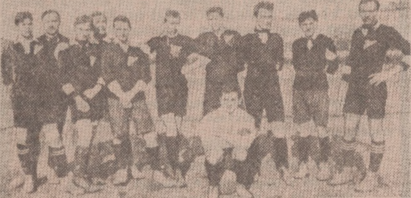
23 lutego 1913 roku Polonia (pierwszy raz w czarnych koszulkach) pokonała Koronę 4:0.

Jak notują kronikarze, pierwszy warszawski mecz piłkarski odbył się w roku 1907, a lepiej grali wtedy reprezentanci z gimnazjum Konopczyńskiego. A później piłkarska zaraza — jak mówili niektórzy panowie z WKS — szerzyła się i w innych szkołach. Pod patronatem WKS narodziła się reprezentacja Warszawy, która najczęściej kontaktowała się z Łodzią. W 1910 roku zjechała do Warszawy Cracovia, a w 1912 lwowska