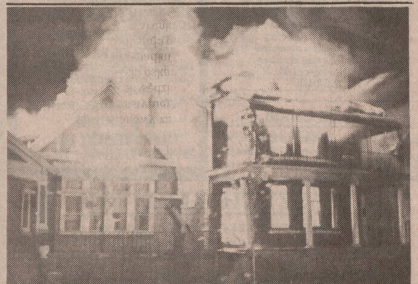
DETROIT — W Detroit w wigilię Dnia Wilkołaków trzeba było patrolować ulice chroniąc domostwa przed wandalami, którzy podpalił domy. Mimo patroli doszło do całego szeregu pożarów. Wandyale wzniciągają pożary twierdząc, że w ten sposób obchodzą "Noc Diabła".

Zarówno matka jak i dzieci są nieprzytomne.