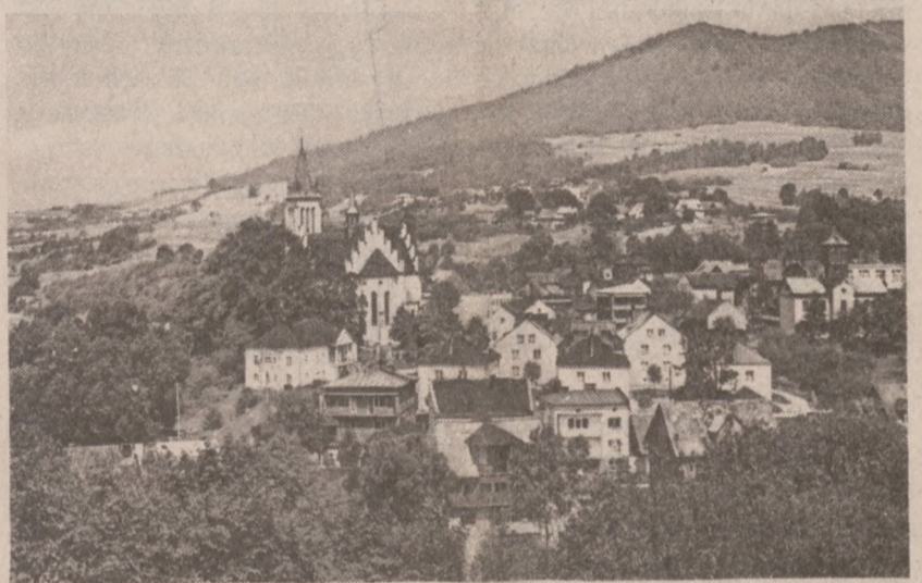
MSZANA DOLNA — Widok ogólny.