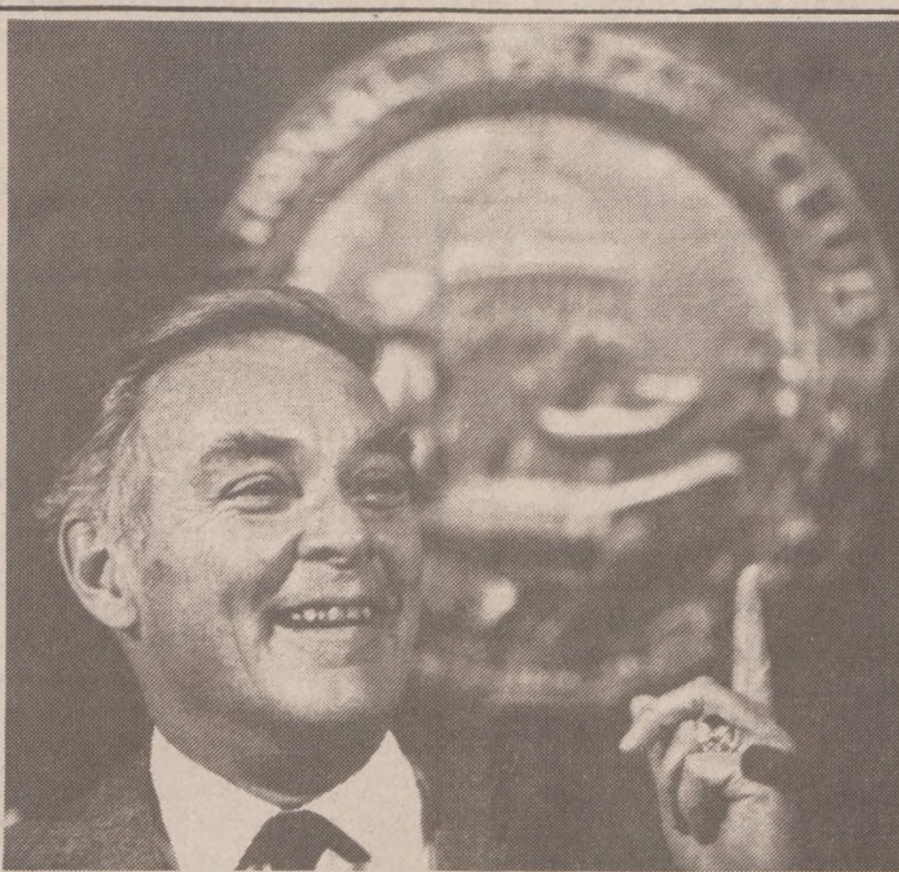
LOS ANGELES — Aleksander Haig, 60, były dowódca NATO, szef sztabu Białego Domu w okresie dwóch kadencji prezydentów-republikanów i pierwszy sekretarz stanu za prezydentury Reagana, sięgnie po nominację prezydencką w wyborach roku 1988.