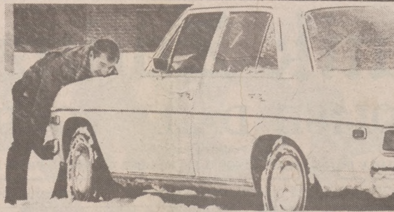
DENVER — 9 grudnia spadł w Dever pierwszy większy śnieg. 6 cali białego puchu poważnie utrudniło poruszanie się po drogach.

ABC przedstawi program dokumentalny poświęcony temu zagadnieniu. Również PBS przygotowała specjalny program poświęcony metodom walki z analfabetyzmem.