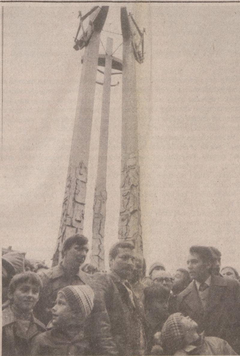
GDANSK — Pomnik Stoczniovcw, wzniesiony w 1980 r. dla upamiętnienia ofiar jakie padły w 1970 r. Zdjęcie to zrobione zostało zaraz po odsłonięciu pomnika w grudniu 1980 roku.

Strajk nie przeszkodził patrolom wojskowym i policyjnym strzeżeniu spokoju w Zachodnim Bejrucie. Żołnierze i policjanci patrolują ulice, by zakończyć dwuletni okres rządów zbrojnych ugrupowań. Pośród zbrojnych chrześcijanami i muzułmanami doszło do kilku starć na linii walki, jaką jest "zielona granica."