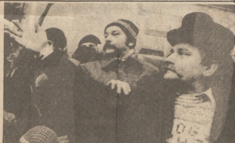
GDAŃSK — Lech Wałęsa po wyjściu z budynku sądowego. Na przewodniczącego NSZZ "Solidarność" czekał tłum przyjaciół.