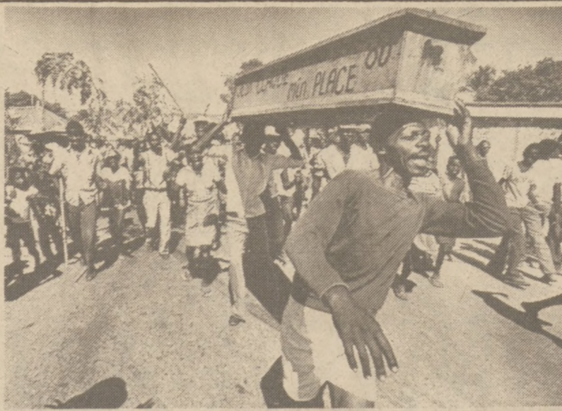
ST. MARC, HAITI. — Podobnie jak w stolicy i innych miastach wyspy, demonstranci nieśli w pochodach trumny dla Jean-Claude'a Duvalier i jego małżonki. Groźna obietnica nie zostanie spełniona — Duvalier zbiegł do Francji.

Biuro Polskiego Ośrodka Informacyjnego znajduje się przy 1200 N. Ashland Ave., w budynku bankowym na piątym piętrze (jest winda), pokój 552. Biuro czynne jest w poniedziałki, wtorki i czwartki w godzinach od 10 rano do 2 po południu.