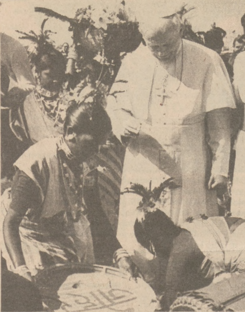
RANCHI, INDIE. — Egzotyczne tancerki towarzyszyły Ojcu Świętemu w drodze do ołtarza. Msza święta w tej miejscowości skupiła ponad 200 tysięcy wiernych.

Z uwagi na oblodzenie dróg, władze w stanach Nowy York, Wirginia i kilku innych, wydały ostrzeżenia dla podróżujących.