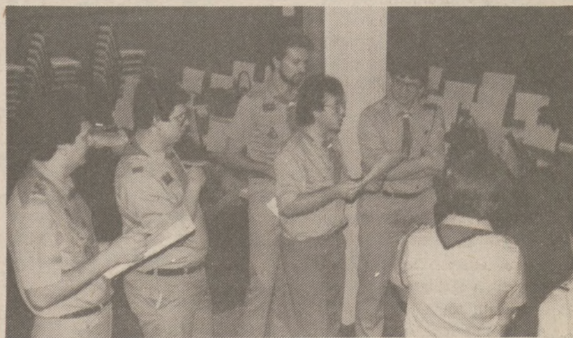
Komenda Kursu omawia wyniki ankiety.

Dalsze wieści z kursu w następnej Kronice.