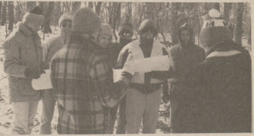
Zadania przed grą terenową.