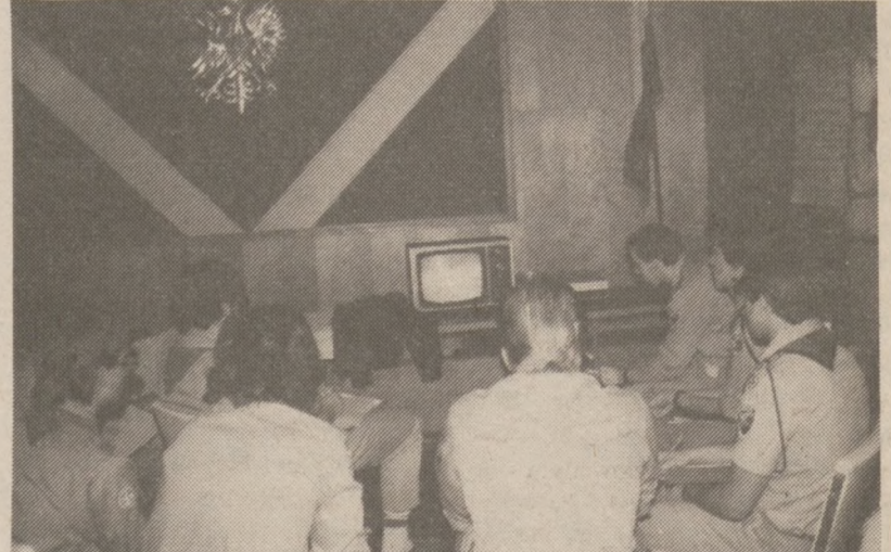
Kurs korzysta z nowoczesnych zdobyczy.