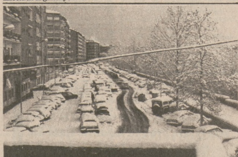
RZYM — Nieczęsto to widok w stolicy Włoch w pierwszej połowie lutego. Śnieg spadł nagle i obficie powodując ogromny chaos na drogach i wiele niegroźnych wypadków.

Pieniądze te zostaną zużyte na programy szkoleniowe, których celem jest zapobieganie porwaniom dzieci, oraz na przygotowanie kartoteki zawierającej informacje o dzieciach zaginionych.