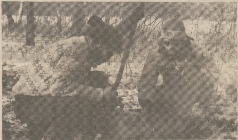
Choć śnieg i zawieje, harcerz na wycieczkę wieje.