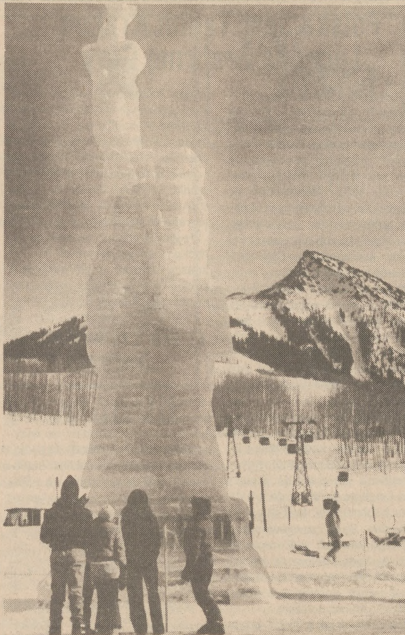
CRESTED BUTTE, COL. — Ta gigantyczna, ponad trzypiętrowa, replika Statu Wolności została wzniesiona na tutejszych terenach narciarskich z 284 bloków lodu o wadze 300 funtów każdy.

Kurs funta bryt. wynosi $1.4565. Cena złota spadła w Zurichu o $3. Za uncję płacono w czwartek $340.50.