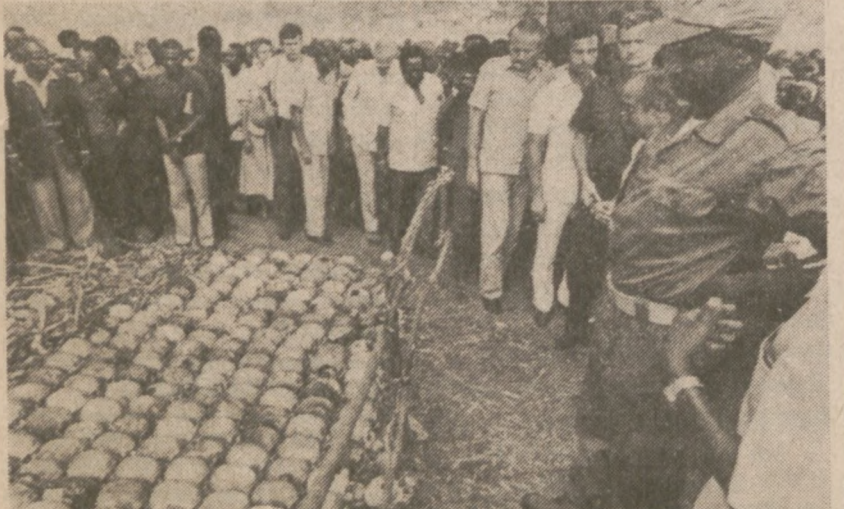
KIBOGA, UGANDA. — Nowy prezydent Ugandy, Yoweri Museveni, pokazuje dziennikarzom i dyplomatom czaszki ofiar poprzedniego reżimu wydobyte z masowego grobu w pobliżu Kampali.