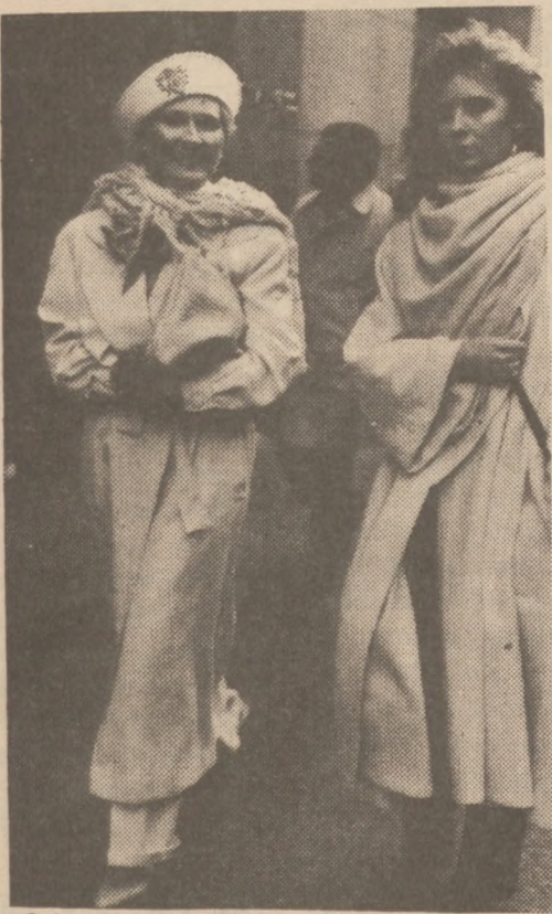
Oto dwa modele płaszczy zimowych, są one w kolorze białym.