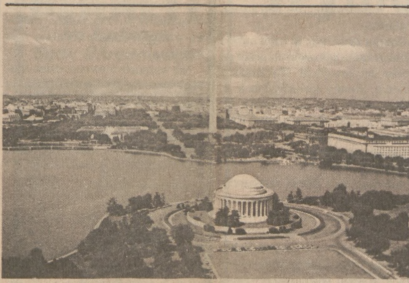
WASHINGTON — Ogólny widok miasta.

Jedynym pozytywnym określeniem, jakiego użył wobec dziennikarzy George Shultz, było zdanie — "spodziewamy się obaj, że dyskusja będzie kontynuowana".