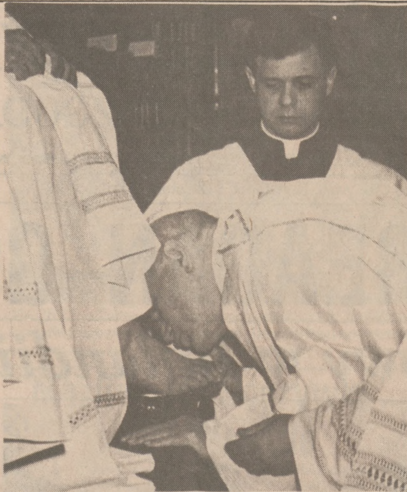
RZYM — To zdjęcie dotarło do nas dopiero teraz. W Wielki Czwartek, podczas Mszy Świętej "in cena Domini" w bazylice św. Jana w Laterano, Ojciec Święty dokonał obrzędu obmywania stóp.

Wszystkie efekty przewidziane przez teorię wykazuje obiekt w gwiazdozbiornie Łabędzia. Dla astronomów nie ma wątpliwości, że jest to właśnie zamknięta we własnym polu grawitacyjnym — czarna dziura. Inną czarną dziurę wykryto poza naszą Galaktyką w Wielkim Obłoku Magellana. Znalezione wprawdzie w naszej Galaktyce już kilkadziesiąt źródeł promieniowania synchroniczne