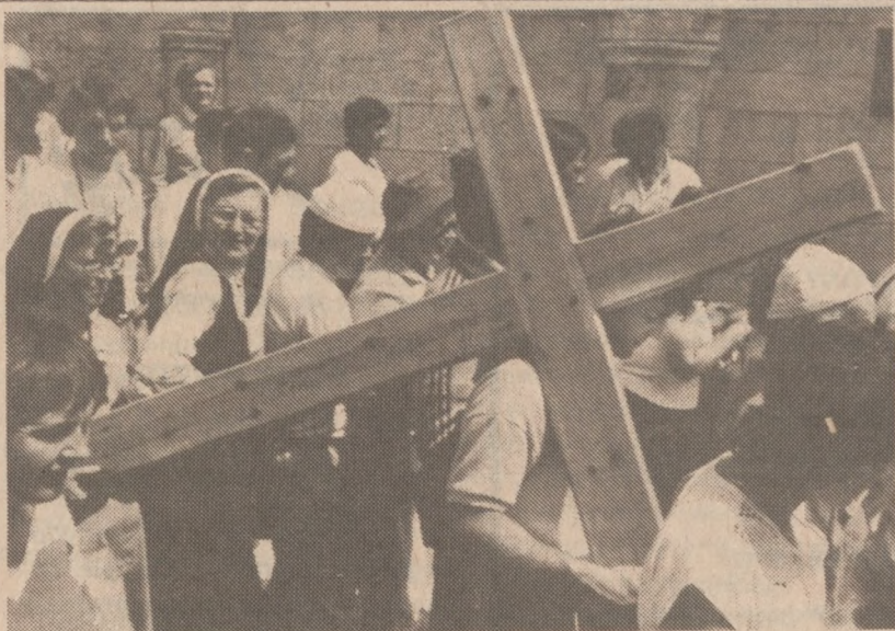
JEROZOLIMA — Starożytną via Dolorosa ku Kościołowi Grobu Świętego przeszły w Wielki Piątek tysiące chrześcijan. W związku z niemającym napięciem na Bliskim Wschodzie udział w Drodze Krzyżowej był znacznie mniej liczny niż w latach ubiegłych.