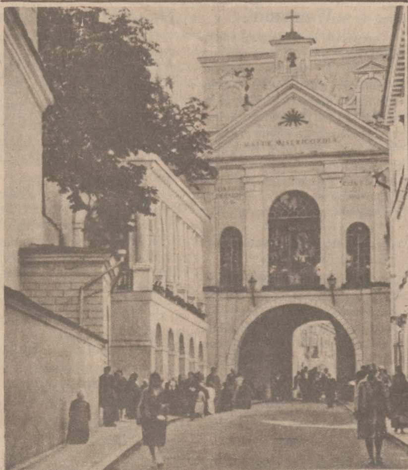
WILNO. — Ostra Brama.

Dyrektor związku hotelarzy powiedział, że władze zniosły obowiązującą od dziesięciolecie segregację w hotelach i restauracjach podających alkohol. Do tej pory niektóre z nich nie mogły obsługiwać Murzynów, Azjatów i ludzi mieszanego ras.