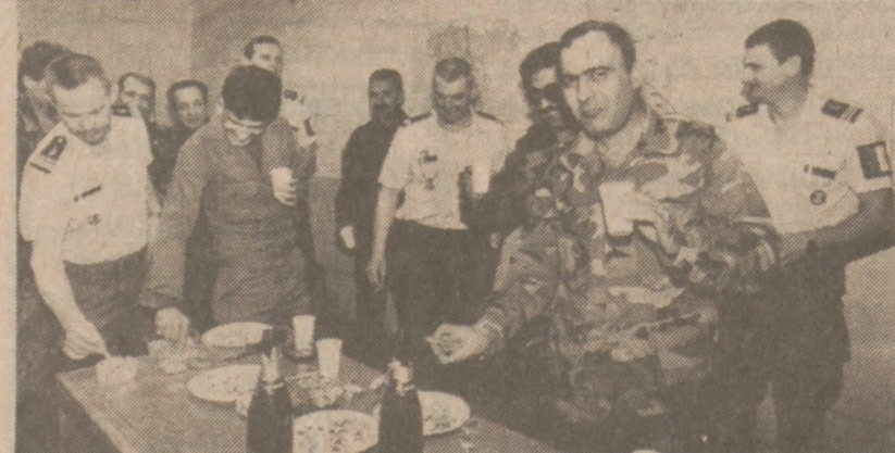
BEJRUT — Ostatni łyk szampana. Oficerowi francuscy, którzy pełnili obowiązki rozjemcy na linii przerwania ognia pomiędzy chrześcijańską i muzułmańską dzielnicą Bejrutu, powrócili do Francji.

Samolot typu Cessna 172 odbił się od pasa startowego w czasie pierwszego lądowania, w czasie drugiego — samolot utracił szybkość i spadł.