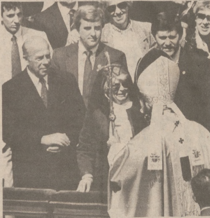
WATYKAN — Po uroczystej Wielkanocnej Mszy Świętej Ojciec Święty spotkał się przed Bazyliką Św. Piotra z sekretarzem stanu George Shultzem i jego małżonką.

Należy się liczyć ze sporym zainteresowaniem tym widowiskiem —