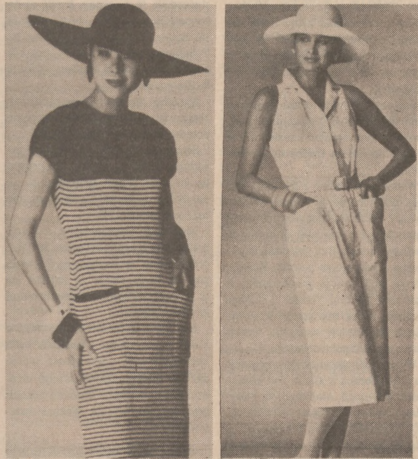
Dwa modele Liz Clairborne, z lewej sukienka dżersejowa w paski z kimono rękawkami z prawej bez rękawów.