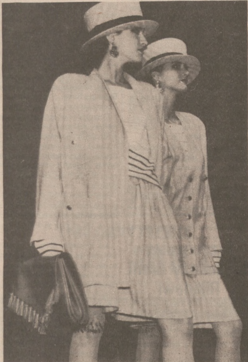
Trzyćściościowe kostiumy zaprojektowane przez Sonię Rykiel.