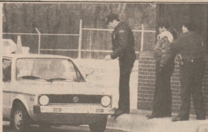
CHICAGO — W całym Stanach Zjednoczonych powzięto specjalne środki bezpieczeństwa na wypadek libijskiego odwetu. Na międzynarodowym lotnisku O'Hare sprawdzano skrupulatnie każdy samochód wjeżdżający w obręb wojskowej części lotniska. (UPI)

W ub. roku władze zdrowia przeprowadziły badania 47,520 dzieci uczęszczających do szkół chicagoskich. Stwierdzono, że w krwi 1,644 dzieci znajduje się duży procent ołowiu.