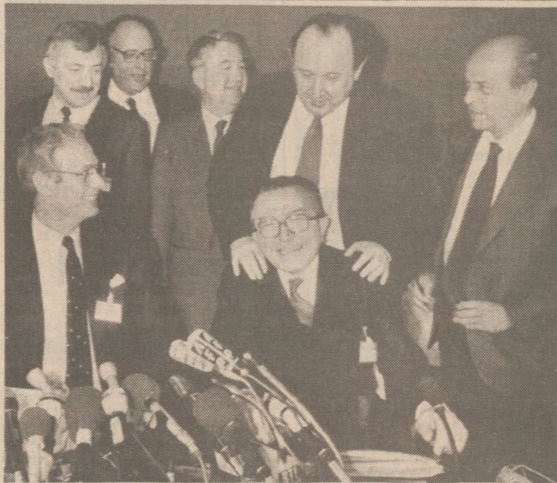
PARYŻ — Ministrowie krajów europejskiej "Dziewiątki" zebraли się 17 kwietnia by uzgodnić stanowisko w sprawie kryzysu libijskiego. (Reuter)

Sprawa miała być rozpatrzona przez sędziego Okręgowego Sądu pow. Cook, Alberta Greena, w czwartek, o godz. 2 po poł.