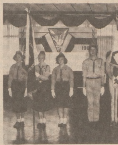
Poczty Sztandarowe: Hufiec "Tatry" i Hufiec "Warta"

Jak bardzo Harcerstwo zrosło się z tutejszym społeczeństwem polonijnym wykazała obecność licznych przedstawicieli prawie wszystkich organizacji polonijnych, od organizacji bratniej pomocy takich jak: