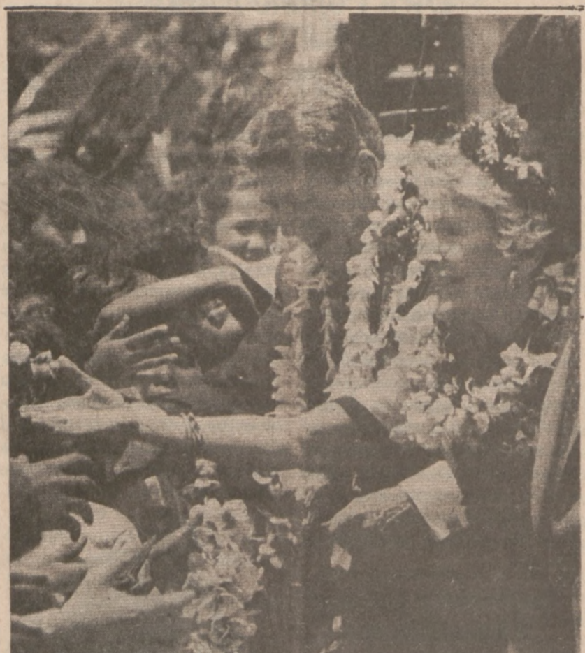
HAWAJE — Powitanie prezydenta Reagana i żony Nancy na lotnisku wojskowym Hickam Air Force Base na Hawajach. Państwo Reaganowie zatrzymali się na Hawajach na dwa dni, aby kontynuować podróż do Japonii, na spotkanie na szczyście.