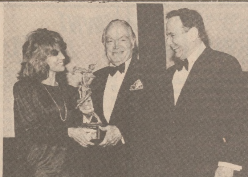
HOLLYWOOD — Bob Hope, znany aktor amerykański, otrzymał w kwietniu nagrodę krajowego stowarzyszenia kompozytorów za propagowanie muzyki w swych filmach i występach.