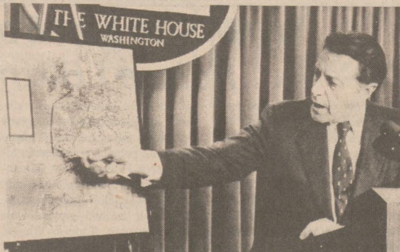
WASHINGTON — Konferencja prasowa po nalocie na Libię. Na zdjęciu: sekretarz obrony, Caspar Weinberger, pokazuje na mapie trasę przelotu samolotów F-111.

Jedyną organizacją broniącą praw człowieka w Gwatemali, jest GAM, utworzona w połowie 1984 r. GAM zajmowała się ustaleniem losu tysięcy "zaginionych" Gwatemalczyków.